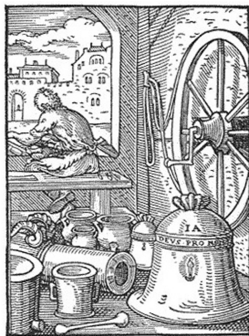
Un taller de fondre de campanes, altres objectes quotidians, i possiblement un canó. Es noti's el mecanisme per aixecar pesos importants. [ Fig. 373 ]

elements defensius, essent l'única força possible en molts pobles d'interior. L'església primitiva de Robines hauria estat inútil per aquesta funció ja a la meitat del segle XIV per una població entre mil i mil sis-cents persones. L'església i els seus voltants foren tradicionalment el lloc de reunió, per assemblees i festivitats. Al costat hi havia el cementeri i una plaça.