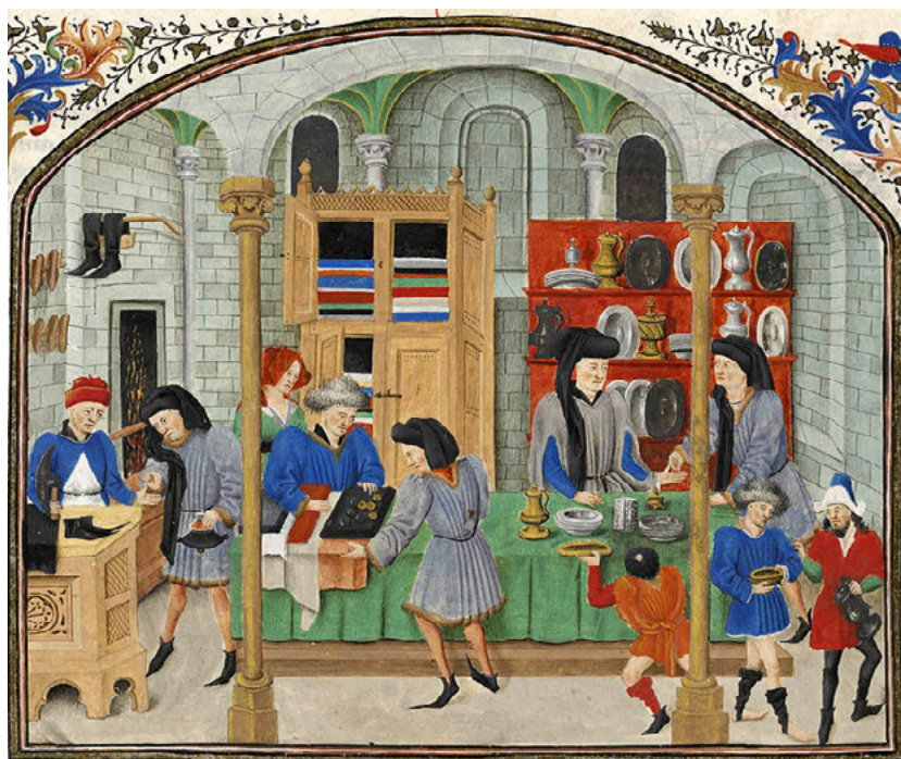
Homes que persegueixen la vida activa: en aquest cas el comerç. Les seves vides eren semblants a les dels nostres suplicants; terratinents i productors de comestibles. Ambdós grups formaven part de la classe mitjana emergent. El seu plaer en invertir i generar riquesa portava adjunt riscos de perdre tots els beneficis i més. [ Fig. 376 ]

(*) Es recorda que el bisbe i el Capítol dels canonges havien fet certes concessions fiscals en establir emfiteusis en la seva terra, uns privilegis que daten del temps de la conquesta, rebuts del rei En Jaume mateix. El rei renunciava algunes prerrogatives seves quan compartia Mallorca amb els magnats.