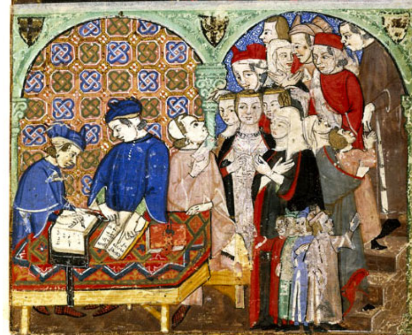
Una oficina bancària de Gènova a l'Itàlia del segle XIV. Aleshores també s'havia de fer coa per treure els diners. [ Fig. 377 ]

èxit i prosperitat de Binissalem? No ho sabem, però les preocupacions dels nostres suplicants, elaborades amb tant d'art, ressonen a través dels segles i ressons de la seva pugna han sonat en altres moments de la història de Binissalem.