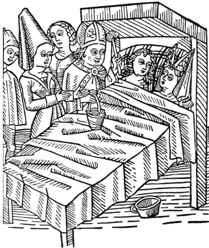
La vida conjugal catòlica amb els noucasats beneïts pel bisbe local. Fins aquí tot bé, però què fa la novia amb aquest pentinat tan exagerat i una expressió de desgrat? Fou l'actitud correcta d'una dona, segons l'església? (De fet, ella és Melusina, una fada, però segons el relat amava el seu marit.) [ Fig. 370 ]

(*) 'el corral on es tanquen els bous que han de córrer' (?) és un joc que no hem aclarit (p. 74).