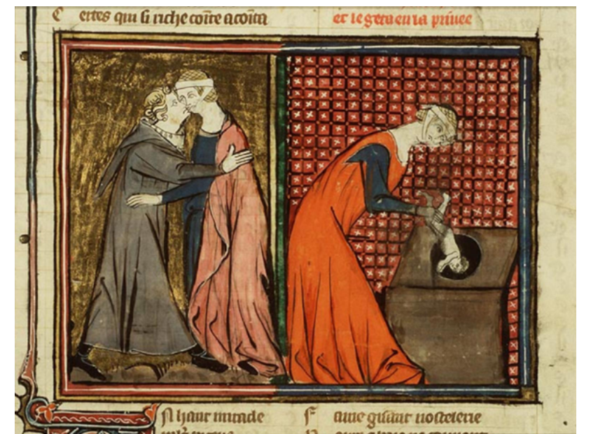
La faceta tràgica del sexe; quan les relacions sexuals no són tan sols un pecat. Aquí hi ha l'exemple d'incest entre mare i fill i l'eliminació del nadó que en resultà. En general la definició medieval d'incest fou bastant ample, però la mare complaent fou considerada un cas especialment greu.* [ Fig. 372 ]