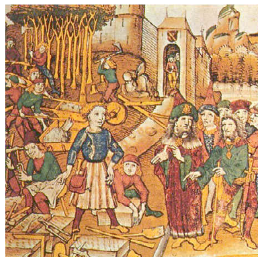
Creant una vila: les autoritats controlen les obres d'extensió de l'àrea urbana en una imatge sense font. [ Fig. 374 ]

A l'any 1360 un Berenguer d'Osona fou batle reial i ja havia ocupat altres càrrecs municipals. És curiós que picapedrers de Ciutat haguessin fet l'obra.