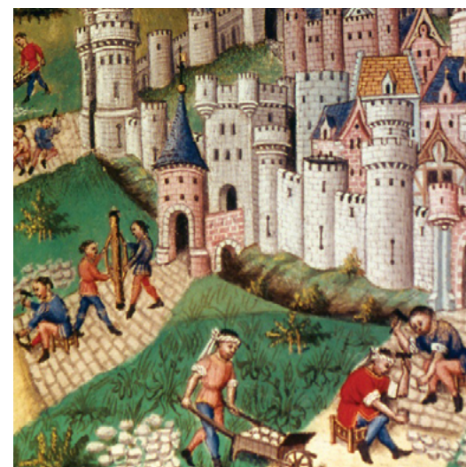
La construcció d'un carrer pavimentat medieval. [ Fig. 375 ]

fou sord també, aleshores tan sols quedà un recurs al delegat del rei. La súplica obrí un ventall de raons per mantenir l'església parroquial on estava. Primer els suplicants presentaren 'el lloc de Binissalem' com un indret separat, quasi aliè a la parròquia. Destacaven que l'església, des dels temps antics havia estat, i encara és, la seu de la parròquia de Robines; mentre que era condemnada a ser enderrocada i traslladada, re et nomine , 'de fet i de nom' al 'lloc' de Binissalem. La parròquia va ser designada com a Binissalem i no Robines.