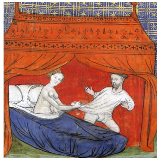
La dona seductora, una il·lustració de la novel·la artúrica, Lancelot du Lac . A vegades és difícil d'aixecar-se del llit... [ Fig. 371 ]