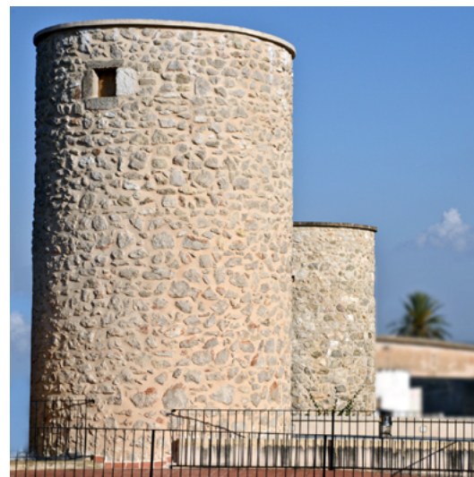
Molins de vent a Inca d'origen medieval. És possible que ni hagués fins a trenta, en consonància amb la importància d'aquesta ciutat. Ara s'han rehabilitat com habitatges els pocs que romanen. [ Fig. 369 ]

El dictamen del governador fou salomònic, ordenant que ningú ha de treballar ni a l'església antiga, ni a la nova; que ambdues han de quedar en l'estat en què estaven. Evidentment, el seu dictamen no fou