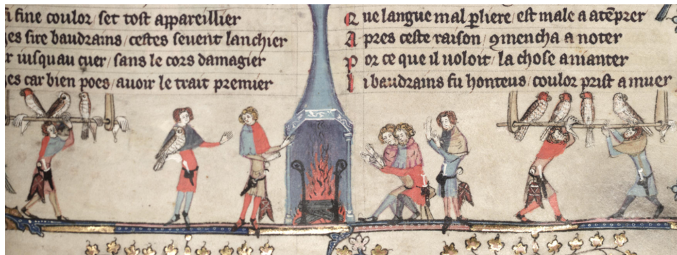
L'altra activitat esportiva que emocionava els rics, homes i dones, fou la caça amb falcons. Les aus destriades eren allotjades i cuidades en condicions de luxe i el seu preu podia ser exorbitant. [ Fig. 362 ]

(*) És molt més conegut el Celler del Rei ara al carrer que té el mateix nom, que data de 1416, edificat en terres de la família Garriga. Són bastants els comentaris que l'identificaren com el primer celler, però això és simplement impossible. Almenys des de l'any 1310 la Procuració reial necessitava com a mínim un edifici com a celler o botiga per guardar els productes del delme o altres impostos en gènere recaptats pel rei. És possible que l'edifici construït el 1416 fos exclusivament pel vi, a diferència d'altres, o és possible que fos una promoció immobiliària pública en benefici particular de la família Garriga, molt ben connectada aleshores a Ciutat. El cert és que no durà molt de temps com a celler del rei. Després se'n féu un ús particular o va ser llogat per l'administració, si és que era de propietat pública.