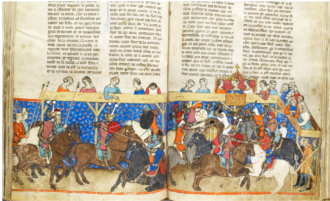
El torneig fou un plaer de l'elit, encara que tothom podia ser espectador. Pels cavallers era l'oportunitat per demostrar les seves habilitats i impressionar les dones com en aquesta bella imatge del sud d'Itàlia. [ Fig. 360 ]

Aquí encara hi ha vestigis de les façanes de quatre cases molt estretes al mateix estil que s'havia fixat en una normativa de construcció a Muro el 1270. Hi ha dues altres cases similars 120 metres al Nord-Oest, al carrer de la Creu. Ambdós podrien ser restes de dues vies amb patis llargs al darrere que tocaven fins que el carrer Nou s'interposà al segle XIV. En aquest carrer s'ubicava el celler del bisbe, i possiblement, l'escrivania i la botiga o celler del rei.