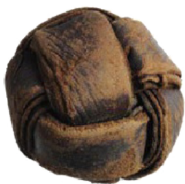
Una pilota del segle XII, feta de quatre tires de pell i farcida amb molsa, materials sempre accessibles. 'L'equipament' dels jocs populars d'antany fou senzill i barat. [ Fig. 355 ]

(*) Pensem que canviar el nom d'aquesta plaça fou un error històric. Ja hi havia una plaça ben documentada a Robines al segle XIV i se suposa que era aquesta mateixa.