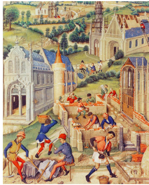
Construcció d'una nova ciutat a França al segle XIV, on començaren evidentment amb les esglésies. Els treballadors probablement eren pagesos pobres que cercaven guanyar-se la vida en la construcció. [ Fig. 364 ]