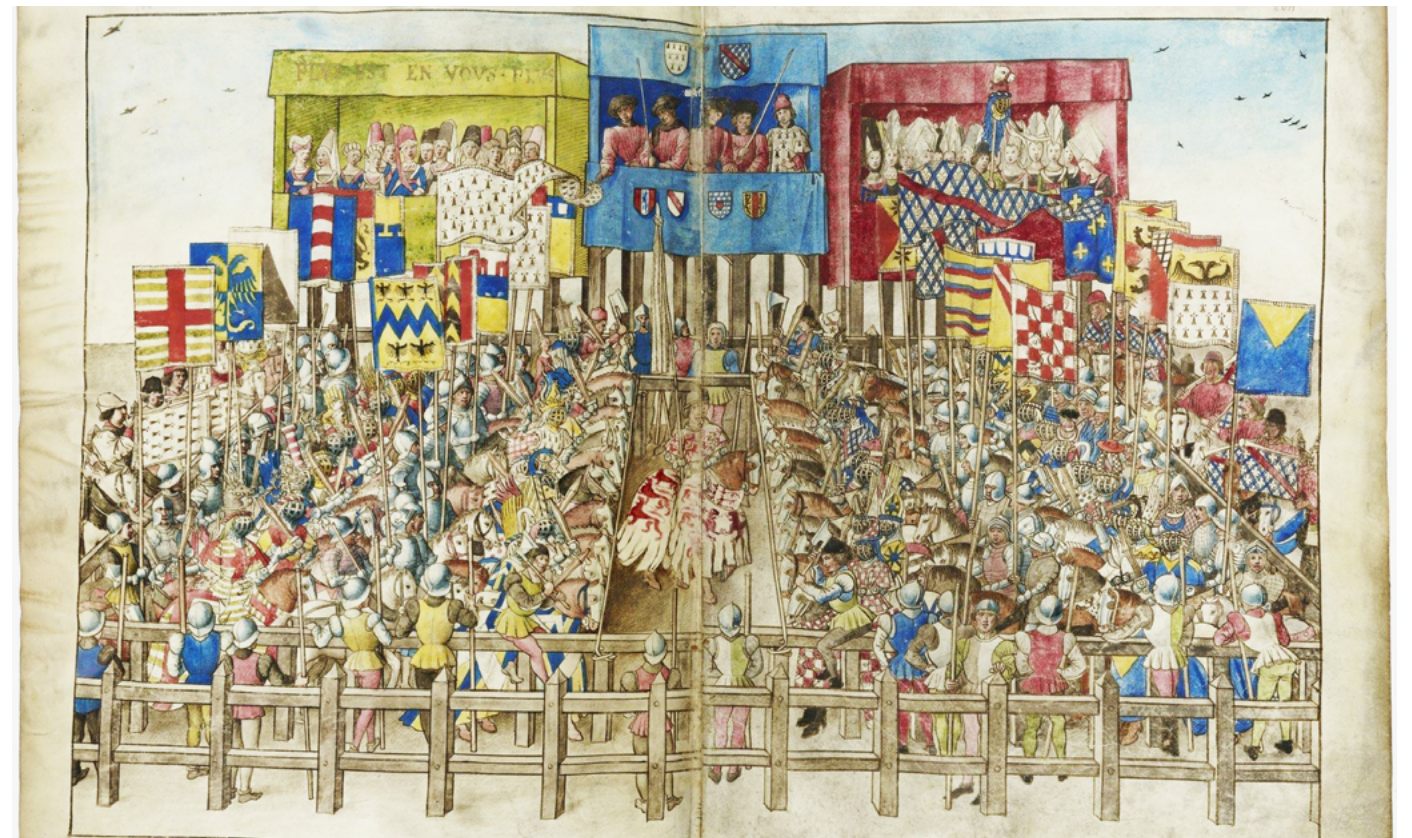
Just abans de començar aquest torneig massiu amb dotzenes de participants, els cavallers juraven respectar les regles. Són pàgines d'un llibre que tracta la gestió de torneigs, escrit pel duc Renat d'Anjou (1409-1480). Durant un temps fou rei de Nàpols, i reclamà la corona d'Aragó també, ja que la seva mare era Violant o Iolanda d'Aragó. [ Fig. 361 ]