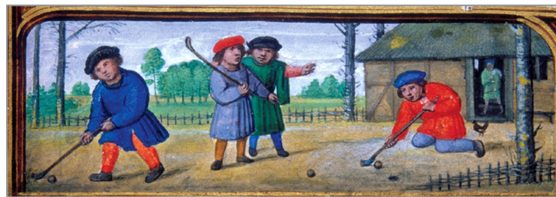
Ja hi havia una versió de golf, però els jugadors no empraven camps grans dedicats només a aquest ús, ni bastons cars. [ Fig. 356 ]

Hi ha un tradició que diu que la primera rectoria fou prop de la plaça d'Olla i prop d'una filera de cases estretes, de menys de 4 metres d'ample amb patis llargs, de fins a 60 metres. Són similar als de la plaça Quartera i del carrer de sa Creu a Binissalem. Són típics de l'estil d'arquitectura, gòtic català, que data del segle XIII. És de gran interès que les bigues d'aquests habitatges estan