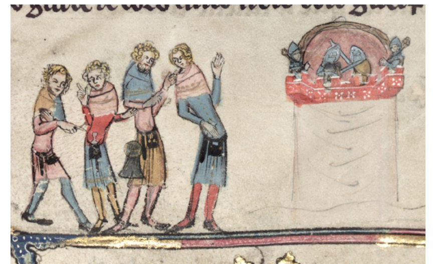
Actes teatrals es limitaven a representacions de la passió de Jesucrist i altres històries religioses durant les festes de l'església. Els titelles fou un plaer accessible a tothom; oferien actuacions amb violència i gens de reverència. [ Fig. 363 ]

(**) És possible que fos descendent del Bernat Pol de 1242, qui establí els primers Gilabert a dos albergs sarraïnescs, també a Binissalem?