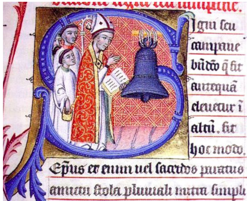
Benedicció del bisbe d'una nova campanya, en una miniatura d'un Pontifical medieval; que són llibres dels ritus duts a terme pels bisbes o el papa. [ Fig. 366 ]

La família més destacada de Biniagol era la dels Bover, que tenia interessos i terres a altres parts de la vila i ocupava oficis públics com Ramon Bover, qui va ser batle el 1348. Una altra família important des de 1285 va ser la dels Figuera, que sembla haver-se originat allà. Un Guillem Figuera va ser batle reial de Canarrossa el 1285, època del Vescomte Gastó de Bearn. Hem conegut ja els veïns Ramonell, Mascaró i Vinyes.