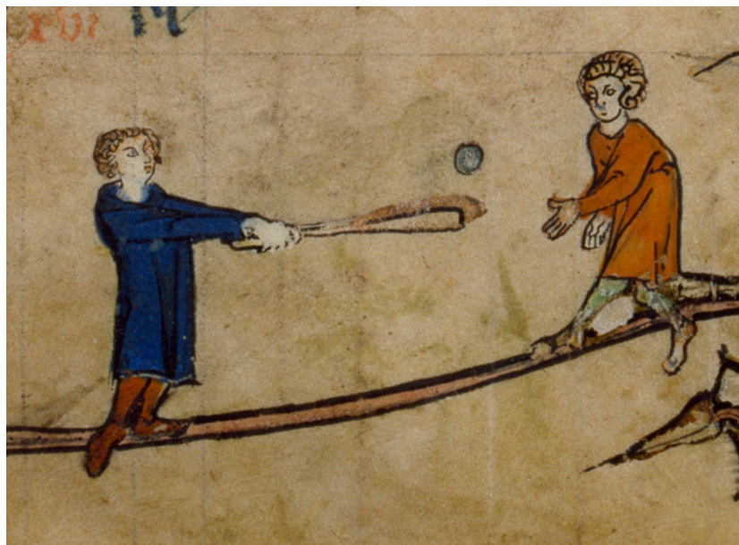
Altres jocs amb pilota foren igualment populars. En aquest, es llançava la pilota des d'uns metres de distància a una placa o tamboret que un altre jugador havia de defensar amb una pala. Aquí juguen al principi del segle XIV, a Flandès, però el joc s'assembla molt al beisbol d'avui. [ Fig. 354 ]