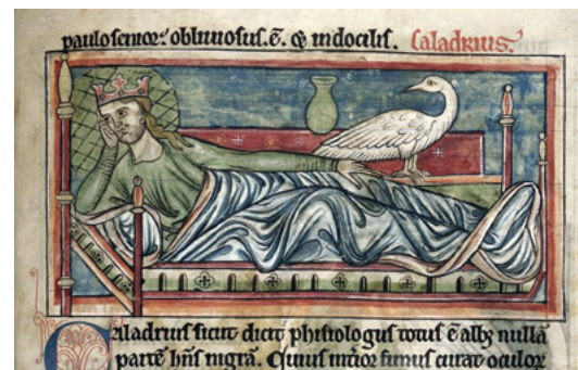
El rei Joan I tengué un regnat breu, de l'any 1387 a 1396, i morí als 46 anys. L'ocell 'caradriu' solia viure al palau d'un rei, era tot blanc i tenia poders curatius; sobretot de pronosticar el destí d'un malalt. Si dirigia la mirada cap al malalt significava que sobreviuria, i que el mateix ocell extreia i neutralitzava la malaltia. No sabem cert si es basava en un ocell existent, però ja s'esmentava a les obres de l'escriptor romà Plutarc, feia més que mil anys. [ Fig. 347 ]

Evidentment qui tenia els llibres no respongué amb celeritat suficient. El