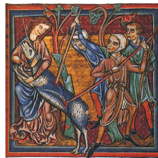
L'unicorn fou recercat pels seus imaginats poders màgics. Era considerat un animal real, encara que ningú podia demostrar que l'havia vist, i segons la tradició només podia ser dominat per una dona, tal vegada verge. [ Fig. 342 ]

L'últim fill de Jaume II, Felip, regent durant la minoria de Jaume III (1324-1329), fou