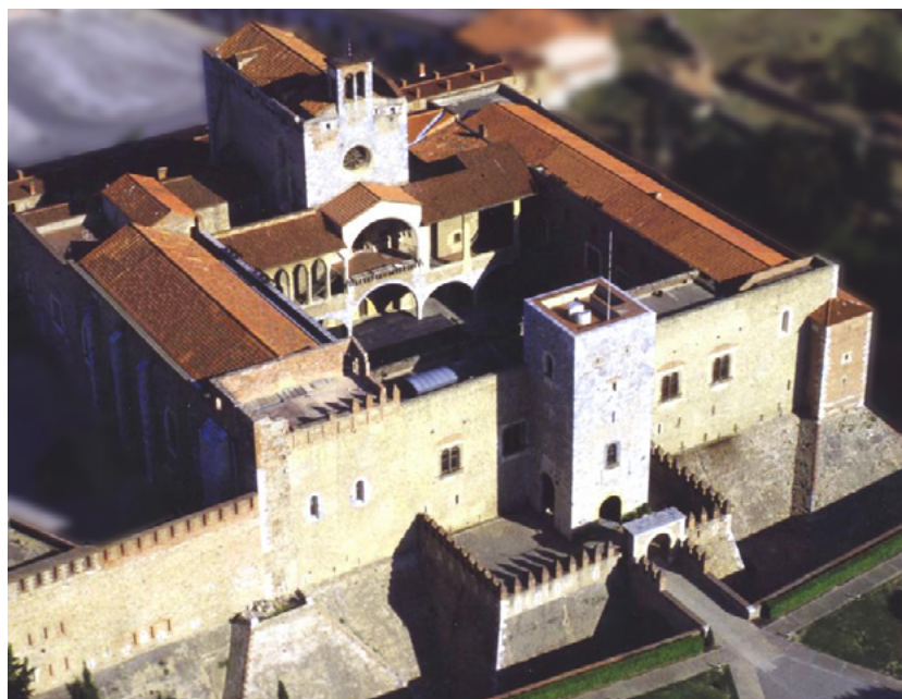
Una vista aèria contemporània del Palau dels Reis de Mallorca a Perpinyà, que va ser construït a partir de l'ascens del Jaume II al tron del Regne de Mallorca l'any 1276. Un altre exemple de l'arquitectura d'aquesta època és el Castell de Bellver, però la residència reial a Perpinyà mancava de l'elegància del de la Ciutat de Mallorca. Al segle XVII sofrí una ampliació i alteració a mans del marquès de Vauban, enginyer francès, quan fou convertit en una fortalesa. [ Fig. 341 ]

els vescomtats d'Omelades i Carlades, més la senyoria de la ciutat de Montpeller (J. Ernest Martínez Ferrando, 1979, p.16) portaven càrregues econòmiques i polítiques que varen enfonsar un territori massa petit. Diferents parts foren objecte de disputa durant més de cent anys, tocant el prestigi reial de França i d'Aragó-Catalunya, pel control de l'àrea estratègica entre ambdós regnes. El moment fou just al començament de la consolidació dels estats/nacions que acabarien formant l'Europa moderna. El rei Jaume I era conscient de la inviabilitat territorial de l'herència del seu fill menor i en repetides ocasions sol·licità al papa permís per annexar al Regne de Mallorca l'illa de Sardenya, però mai rebé una resposta favorable.