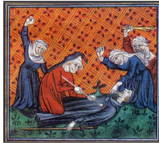
Potser bastants mallorquins se sentien tan indefensos com la víctima d'aquest atac brutal en ple camí, als últims anys del segle XIV. Noteu les faccions animals de la cara d'un dels atacants. [ Fig. 350 ]

Just acabats els quatre dies de festa, el rei es tancà a Bellver o Bunyola. Tenint en compte les amenaces esmentades en aquesta carta, no sembla que el representant del governador anticipés gaire entusiasme per festejar el rei.