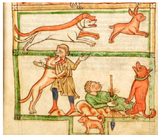
El ca simbolitza la fidelitat. En aquest detall de panells, a dalt n'hi ha dos que persegueixen un conill i a baix n'hi ha un de fidel que apareix representat dues vegades, plorant la mort del seu amo i atacant el seu assassí. [ Fig. 346 ]

1395. Una vegada arribat, el rei es tancà a les possessions reials i no en sortí fins a l'hora de tornar a la península.