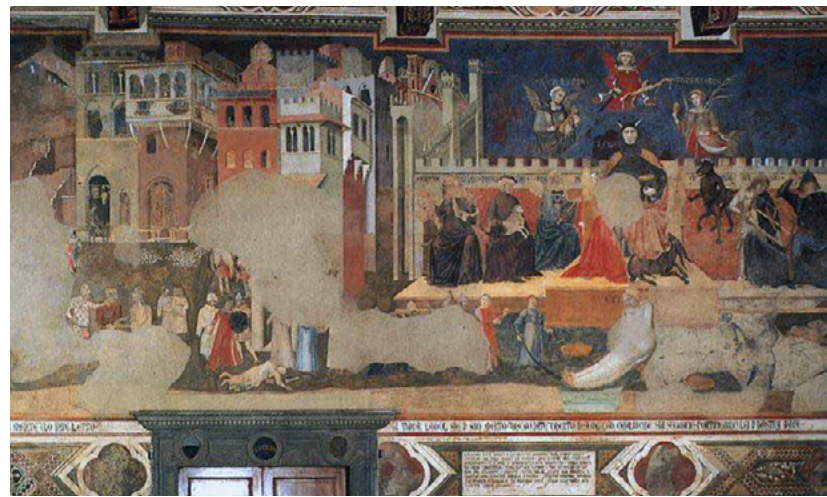
Els efectes del bon i mal governament en una ciutat medieval: Siena. Són detalls de frescos d'Itàlia de 1338-1340. El fresco del mal governament està bastant destrossat. A Mallorca, l'entrada de mercaderies del camp a Ciutat pagava un impost a partir de la dècada de 1330. [ Fig. 344 ]