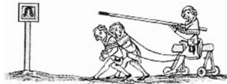
El futur cavaller començava el seu destriament als set anys. Els nins practicaven colpejar un estaquiro, prova universal de destresa per un cavaller. [ Fig. 325 ]

Curiosament un senyor, un donzell escuder o cavaller, i binissalemer de família, escriví i publicà un poema narratiu al segle XIV: La Faula de G. de Torrella, vers a l'any 1375. Guillem de Torrella era d'una família poderosa i nombrosa, d'un llinatge