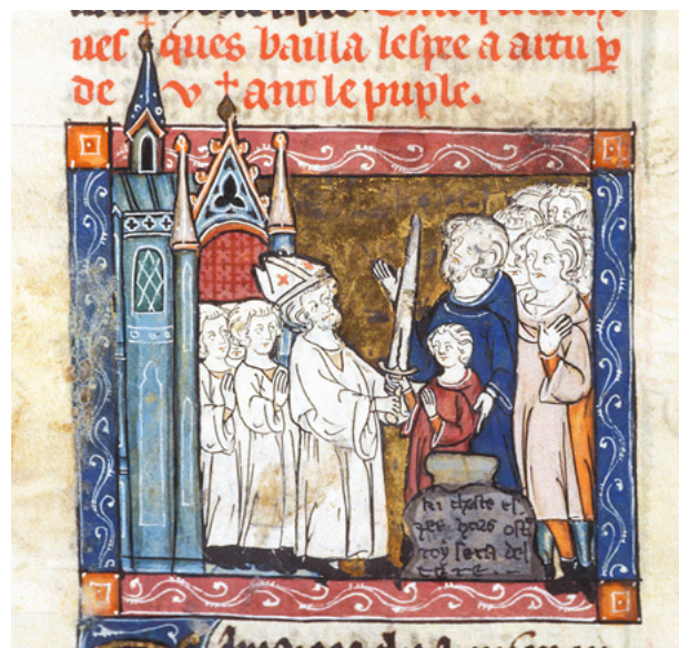
Artús, en ser infant, rebia l'espasa Excalibur del la mà d'un bisbe, després d'haver-la retirat de la pedra. [ Fig. 334 ]