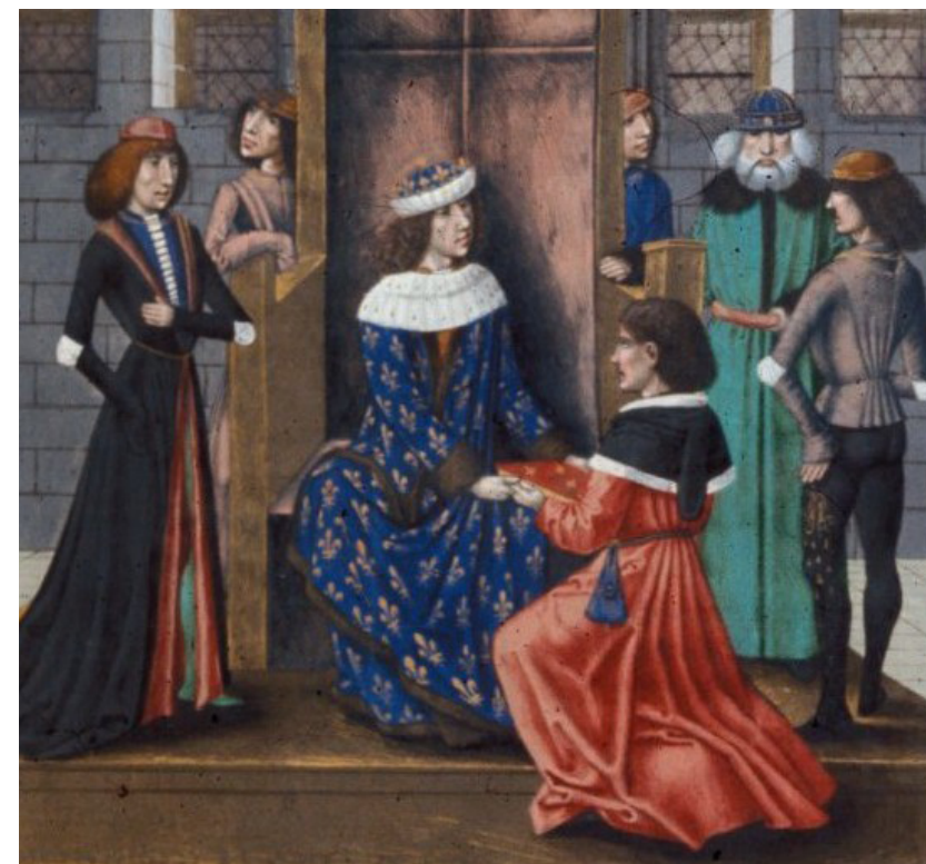
Aquí el rei Carles V de França, el Prudent (1337-1380) accepta un llibre del seu autor. Christine de Pizan havia escrit una monografia sobre la vida diària del rei, on diu que després de despatxar assumptes d'estat, “A l'hivern, particularment, el solia ocupar-se en oir llegit bones histories de les Escripures sagrades, o 'els fets dels romans' o 'màximes dels filòsofs', entre altres temes similars, fins a l'hora de sopar.” (Del Livre des faits et bonnes mœurs du sage roy Charles V (1404) Christine de Pizan) [ Fig. 339 ]

Sembla que el rei Pere IV, home que apreciava els valors tant com la utilitat dels