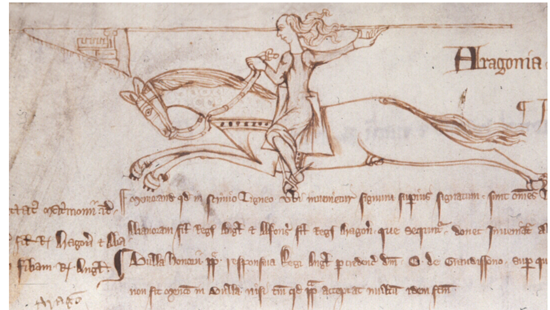
Un escuder exhilarant galopa en harmonia total amb el seu cavall i la seva llança. És un dibuix amateur que comunica l'emoció d'un moment perfecte. [ Fig. 337 ]

Tampoc fou clara la qüestió. Ambdós reis foren descendents de Jaume I, que havia mort tan sols 73 anys abans de Jaume III. El rei de Mallorca havia jurat fidelitat al rei de Catalunya i Aragó des de l'any 1279. Entre les tropes de Pere IV hi havia familiars dels adherents al rei Jaume III. De Torroella de Montgrí a Catalunya, per exemple, venia amb el nou rei un Guillem de Torrella i un Arnau de Torrelles. No dubtam del sentiment dels partidaris de Jaume III, però