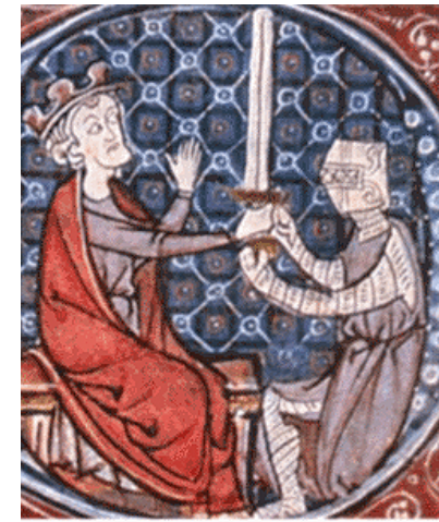
Una part de la investidura d'un nou cavaller era en rebre l'espasa de la mà del rei, moment en què ja s'anava vestit amb armadura. [ Fig. 326 ]