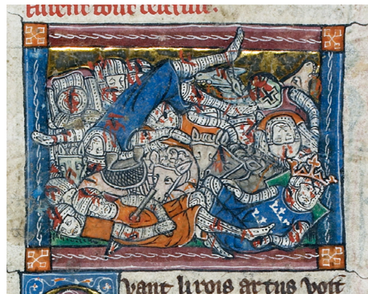
Del mateix llibre de la vida de Lancelot que les altres imatges, aquí veiem la fi del regne de Camelot. [ Fig. 335 ]

Deduïm que el declivi en la salut psíquica del rei Artús corre en paral·lel amb el declivi de la pràctica dels valors cavallerescs. Així com el seu regne representava la realització de l'ideal de valor, virtut i bon comportament cavalleresc, la seva malaltia pot simbolitzar el perill d'extinció d'aquest ideal, encara corrent vers la dècada de 1370.