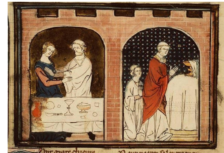
Un clergue que ha sobrepassat els límits de llibertinatge resulta privat dels sagraments. [ Fig. 320 ]

El 1372 hi hagué un altre cas notori, aquesta vegada a Binissalem, que despullava alguns dels mals de l'església medieval i acabava amb la paciència del bisbe Antonio de Galiana.