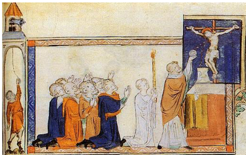
Celebrant l'eucaristia del corpus christi en una església molt similar a la primera església parroquial de Binissalem. [ Fig. 318 ]

havia de ser enterrat en un lloc sagrat per esperar la desitjada resurrecció. Per això era necessari la presència física d'un servent de l'església, un edifici consagrat al culte i un cementiri.