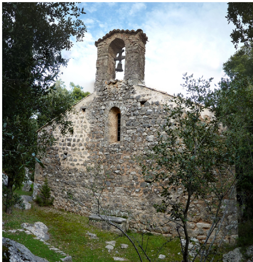
L'església de Sant Pere d'Escorca, que data dels primers anys del regne del rei En Jaume. La nostra església primitiva, Santa Maria de Rubines, no devia ser molt diferent. [ Fig. 323 ]

La còpia del Capbreu que hem consultat (a l'Arxiu Capitular de la Seu de Mallorca) sembla més un esborrany que un document final de tanta importància pel regne. Ni la col·locació de les notes a les pàgines, ni la cal·ligrafia es correspon al pes del seu contingut. Com a document preliminar es podria explicar la seva manca d'organització.