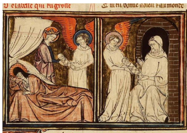
Una abadessa ocupà un càrrec que no permetia mantenir un fill il·legítim. Per respecte al seu rang, un àngel dona el bebè no desitjat a la cura d'un ermità. Aquest sembla sorprès o desconcertat, potser una reacció natural. [ Fig. 319 ]

Continua, "Estos hijos no son fruto de un trance pasajero u ocasión fugaz, sino más bien de amistad