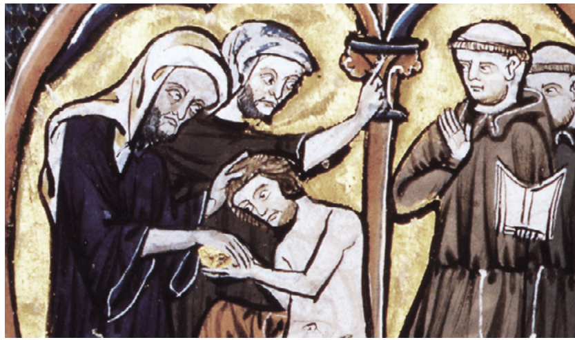
Detall d'una miniatura que representa bons homes càtars que repudien dos frares: un dominicà i un franciscà. Representants de la Inquisició papal foren enviats, el 1233, a escoltar i anotar el testimoni de tots els adults a les àrees càtares. Els bons homes solien viure i viatjar en parella (rebutjaven el matrimoni) i la seva roba preferida fou de color negre, però amb l'augment de la persecució tan sols portaven un cinturó negre. [ Fig. 321 ]

Roma i tornava alegant que havia obtingut una canongia a les corts apostòliques; però la jerarquia mallorquina en dubtava, de la seva veracitat. El 13 de novembre s'enviava formalment " l'excomulgació de Pedro Artal per no haber posat fianzas en el pleit " (J.N. Hillgarth i Joan Rosselló Lliteras, 1989, documents 174 i 175). El total de documents referents a l'assumpte són: 167, 170, 173, 174, 175, 177, 180, i 186.