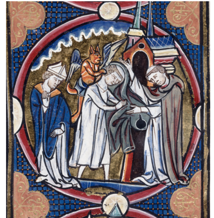
Igual que tothom, els homes de Déu foren subjectes a les temptacions del mal i no tots podien resistir. Aquí un capellà es treu la roba per descobrir un diable posat a l'esquena. [ Fig. 317 ]

La societat sobretot exigia d’un rector, la seva presència. En el moment de la mort el rector era essencial, perquè una ànima que no havia rebut els últims ritus i benediccions de l’església estaria condemnada al purgatori, quasi el pitjor que li podia passar a un cristià. Fou fonamental l’esforç per aconseguir una bona mort.