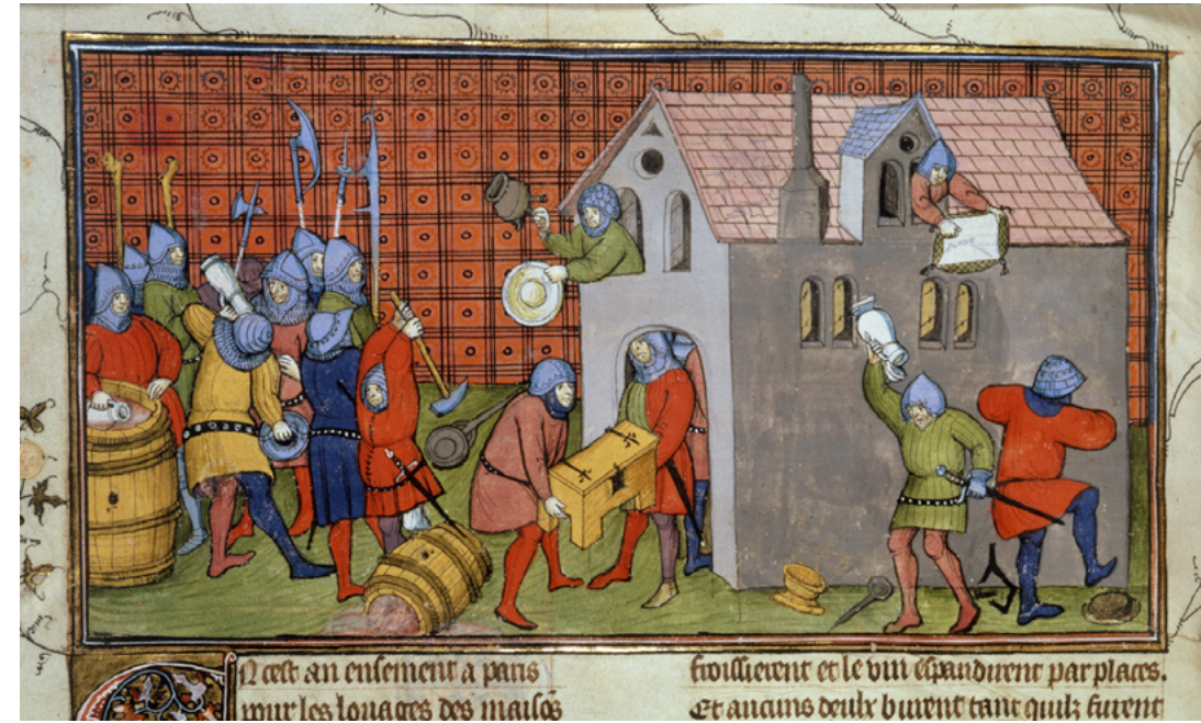
Amotinats saquejant cases durant una rebel·lió, en aquest cas a París, el segle XIV. [ Fig. 298 ]