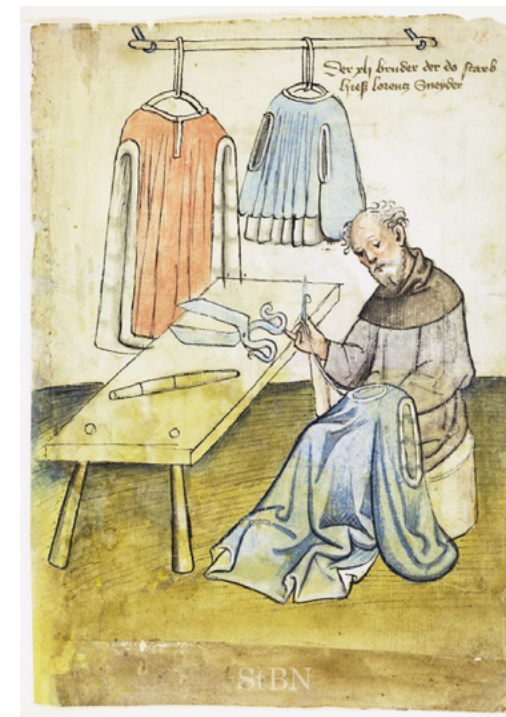
Un sastre del final del segle XIV. [ Fig. 299 ]

En el testimoni dels dos jueus d'aquest judici (el denovè del llibre) ells reconten les seves activitats un dissabte, el seu 'shabbat'.