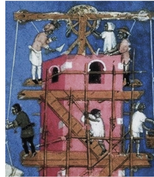
Diversos homes treballant en la construcció d'una torre. [ Fig. 292 ]

Es podrien mostrear uns laments poètics d'enyorança escrits per fugitius musulmans, en aquest cas de València, a la biografia del rei En Jaume (Antonio Furió, 2007, p. 92 i 93). La