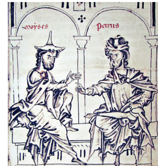
A l'edat mitjana, a les persones sàvies i cultes, els va agradar dialogar o debatre amb persones de diferents religions, de la superioritat de les pròpies creences. Ramon Llull gaudia molt d'aquests exercicis. Aquí una conversació animada entre un jueu, Moyses, i un cristià, Petrus; il·lustració dels Dialogi contra Iudaeos del segle XIII. [ Fig. 293 ]

Malgrat la seva integració a la societat i al Regne de Mallorca, les doctrines de l'església obraven en la seva contra. No era tan sols la intolerància notòria d'una religió per una altra; els jueus foren considerats, a vegades personalment, responsables de la mort de