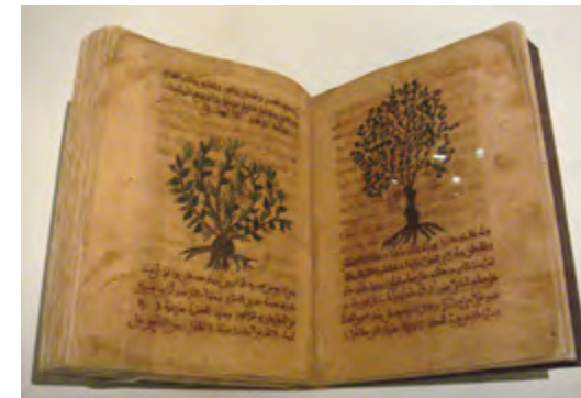
El 'pare' de la medicina medieval fou el grec de l'Àsia menor, Pedaneus Dioscòrides del primer segle dC que escrigué una enciclopèdia farmacèutica en cinc toms: De Materia Medica , en llatí. Fou un metge de l'exèrcit romà i viatjava per tot l'Imperi romà. El llibre fou copiat i traduït durant segles i arribà a la península Ibèrica a mans dels àrabs d'Al Andalus. Aquest exemple fou copiat allà al segle XII. [ Fig. 216 ]

L'esclau ordinari fou un treballador forçat, obligat a fer feina fins que ell mateix, o amb ajuda de familiars o amics, pogués pagar el seu preu de compra o fins que fos alliberat per la clemència del seu propietari. El seu règim més freqüent fou un contracte de la talla , un senzill acord en el qual l'esclau pagaria una quantia estipulada del seu salari fins que hagués satisfet el preu que el seu amo ha pagat per ell. Sembla, a l'aparença, relativament benigne; equiparable fins a un punt amb el sistema jueu d'esclavatge temporal, practicat entre ells. Si hagués existit un sentit de malestar o vergonya per la situació dels esclaus, règims com la