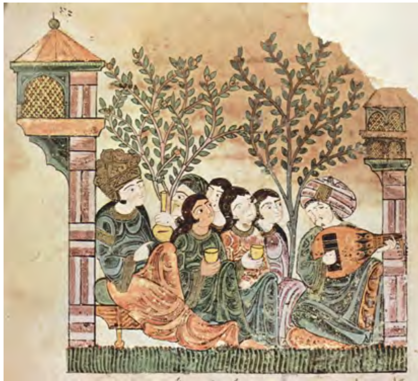
Una gran paradoxa de la dependència de l'economia mallorquina cristiana d'esclaus i esclaves fou la proximitat a Al Andalus, una societat avançada i sofisticada, mentre a Mallorca els correligionaris d'aquest foren relegats a no més que mercaderia. En aquest fragment d'un fresc andalusí del segle XIII, unes dones musulmanes escolten un músic. [ Fig. 215 ]

Les comunicacions havien de ser freqüents i aquest atemptat sembla un segrest típic, per diners.