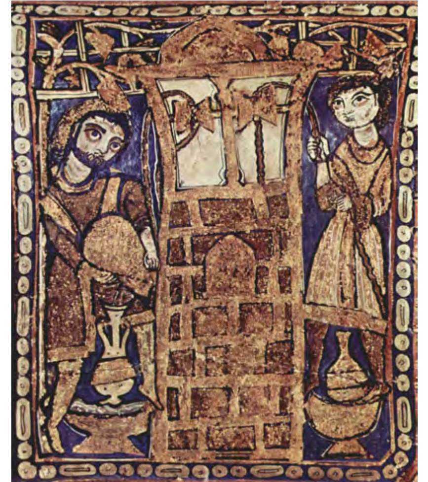
Aquesta imatge de dos joves musulmans a un pou, és del sostre de la Capella Palatina a Palerm, capital de Sicília. La capella, decorada vers el 1150, és una obra d'art impressionant a més d'un exemple de la coexistència pacífica momentània de cristians i musulmans. Combina art cristià i islàmic en un tour de force únic. Fou executat durant el regne de Roger II, un rei cristià, però el seu estil és eclèctic i el sostre mostra influència bizantina a més d'iconografia àrab. Es poden veure més fotos similars al website: http://warfare.meximas.com/12/Cappella_Palatina-ceiling-Birds.htm [ Fig. 221 ]