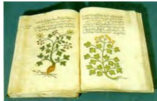
Ibn al-Baytar nasqué prop de Màlaga a finals del segle XII i viatjà durant vint anys recollint plantes per les terres islàmiques del nord d'Àfrica fins arribar a Damasc, on moria el 1248. Important a la història de la botànica, escrigué una compilació que inclogia 1.400 plantes alimentàries i medicinals, que foren emprades fins el segle XIX. Aquí una pàgina d'un llibre de cures seves. [ Fig. 218 ]

L'administració volia assegurar que els esclaus sentissen força por i, al mateix temps, crear un coupure définitive , un tall conclouent: jurídic, polític, moral i material entre homes lliures i esclaus. Aquesta 'fossa', com ho caracteritza Besc (1990, p. 93), inclogué limitar els poders dels amos sobre els esclaus, reemplaçant-los pel poder governamental. El mestre de guaita tenia el poder d'imposar les mesures de supervisió