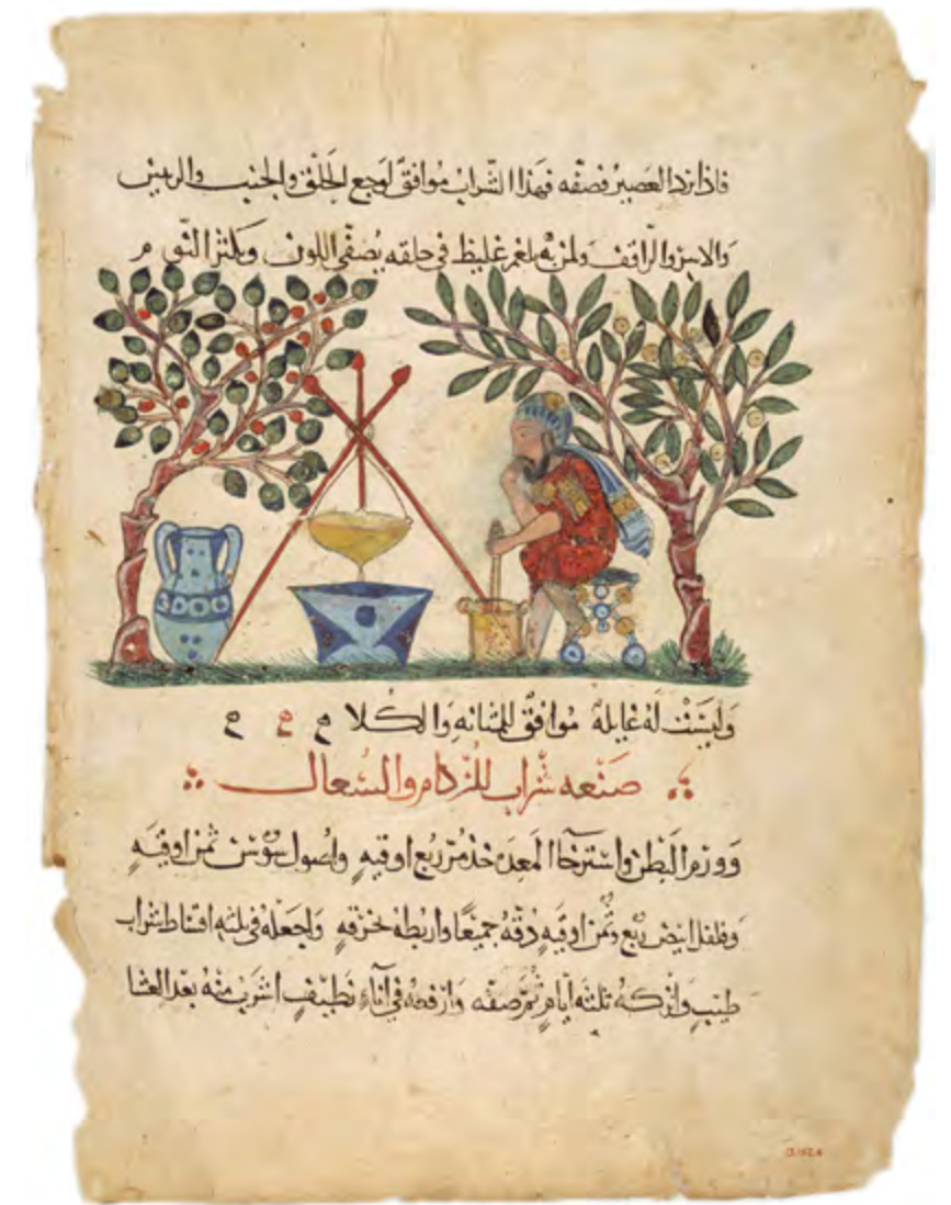
En aquesta il·lustració d'una còpia dels toms de Dioscòrides, feta a Bagdad el 1224, un farmacèutic àrab prepara un medicament de mel. [ Fig. 217 ]

si mancava mà d'obra. Hi havia carència de mans durant els segles XIII i XIV, una situació accentuada després de la pesta negra durant la segona meitat del segle XIV. L'home havia de pensar en com seria la seva relació amb l'esclau o esclava, ja que visqueren junts, quasi del cert en un espai petit, i probablement l'amo havia de concedir un grau de confiança a l'esclau. Com ha de ser el seu tracte amb un humà que havia comprat amb diners i de qui espera un rendiment de treball? Molt distint era el