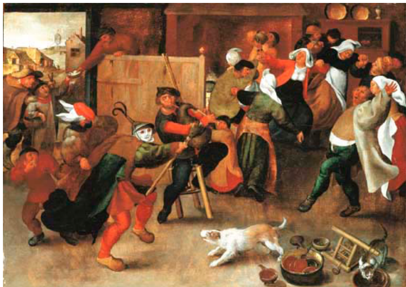
Les imatges més famoses sobre festes pageses probablement són les dels pintors dels Països Baixos. La visió popular de festa perfecta podia haver estat similar a aquesta de Marten Van Cleve. [ Fig. 204 ]

És evident que el rector no podia fer res contra la festa popular com a rival, si no era amb el reforç d'una amenaça governamental: “E asso no mudets en alcuna manera”.