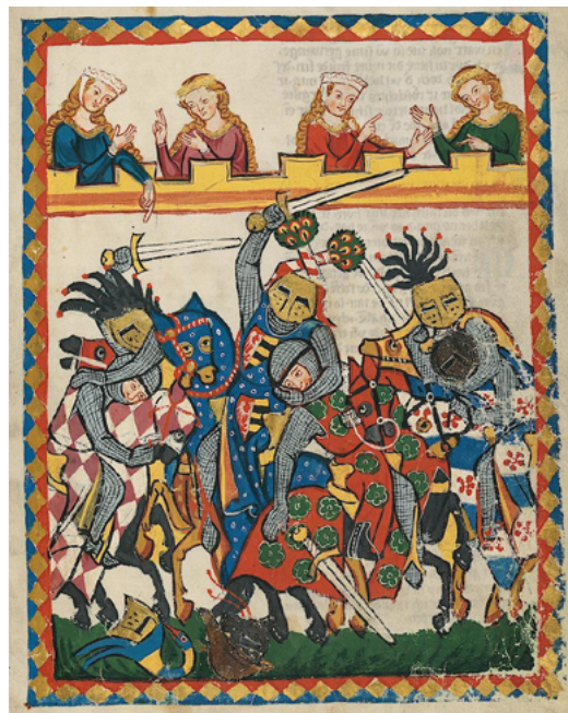
Un torneig a l'estil que emocionava les classes altes. Aquests cavallers actuen seriosament, no és un joc. [ Fig. 206 ]