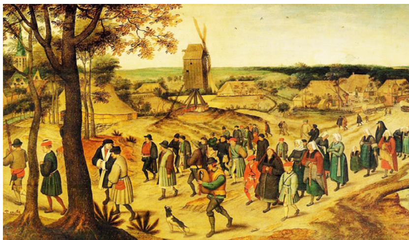
Pel que fa a l'església, aquesta apaivagada caminada a la missa, on els homes van per un costat, i les dones i nins per l'altre, hauria estat molt més al seu gust. La pintura és de Pieter Bruegel el Jove, que, com Marten Van Cleve, fou del segle XVI i inicis de XVII. [ Fig. 205 ]