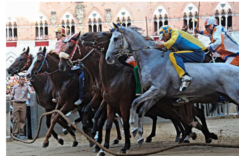
El palio, una carrera de cavalls medieval que és encara celebrat cada any a Siena, Itàlia. A l'edat mitjana mai s'empraven selles a les carreres. [ Fig. 208 ]

No organitzaven carreres de cavall a tots els pobles; era imprescindible un bon nombre de veïns acomodats que tinguessin cavalls capaços de córrer. Penseu que emocionant era; fins i tot perillós, participar o assistir a carreres de cavalls a camp obert. La forma de la denúncia suggereix que no hi havia