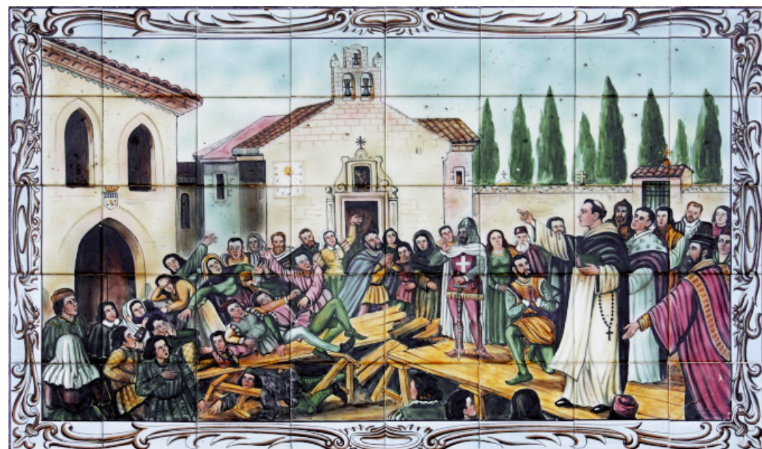
Sant Vicent Ferrer (1350-1419) dominicà de València, era el predicador més conegut de la seva època i visità Mallorca en diverses ocasions. Aquesta rajola moderna conta 'el miracle de Nules', una vila de Castelló on col·lapsà una tarima per mor del pes de les persones que havia damunt escoltant un sermó del frare. Cap persona resultà ferida. [ Fig. 209 ]

que la meitat. L'església havia fet coincidir les festes cristianes amb velles celebracions paganes i intentava dirigir-les cap a actes de reafirmació i dedicació, per tal d'assegurar el benestar i la prosperitat del poble, seguint les seves normes. Tal seriositat fou el contrari del que cercava la gent; així s'hauria de presentar la religió amb una nova cara.