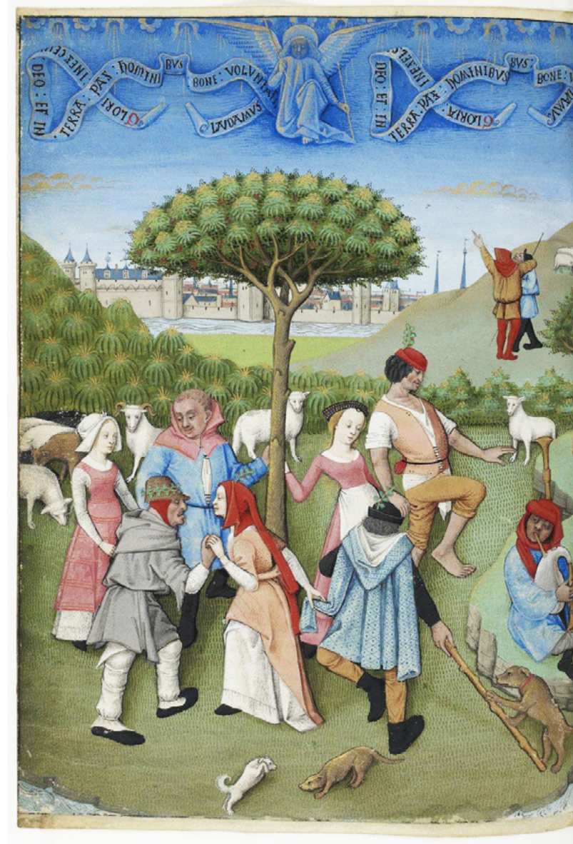
Una ressaga pagesa d'un manuscrit francès, Les Heures de Charles d'Angoulême . [ Fig. 210 ]