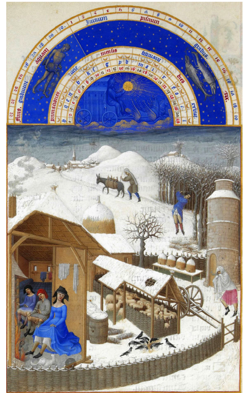
Pagesos francesos gaudint d'un bon foc contra el fred de l'hivern. Viuen dins la petita edat de gel , amb temperatures hivernals notablement baixes. És febrer al Tres Riches Heures del duc de Berry, un manuscrit francès molt conegut. [ Fig. 194 ]

Detallat és el contracte, una característica dels tractes medievals. Ens inclinem a suportar el concepte de 'treball' exposat