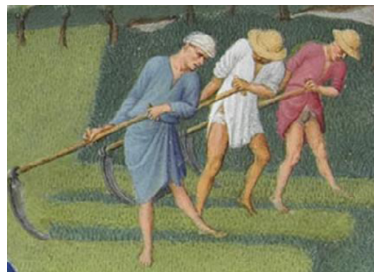
Jornalers segant. Podem apreciar el seu esforç en fer un treball dur. Un detall del mes de juny al Tres Riches Heures . [ Fig. 198 ]

Els podien fer contractes amb els seus amos i a vegades amb tercers. Dins el