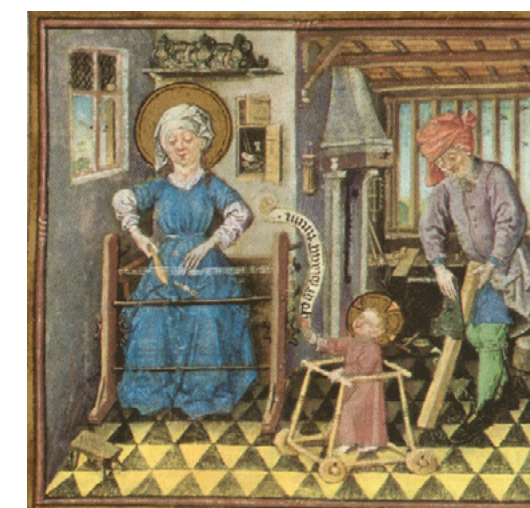
Una representació curiosa de la santa família com artesans. Sembla una família benestant, també. Reflecteix l'augment de la importància econòmica de la classe obrera? [ Fig. 200 ]

Sempre són necessaris alguns artesans concrets en qualsevol societat, però en els inicis del poble hi havia poc desenvolupament de tals activitats. Uns tècnics com el ferrer, el picapedrer o el fuster, el sabater o el moliner foren imprescindibles, però és probable que els seus oficis fossin combinats amb la pagesia.