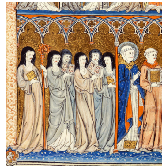
Un grup de monjes cistercenques en una processó religiós. Elles porten breviaris elaborats i decoratius, no es dediquen a la pobresa. [ Fig. 192 ]

En el otro extremo de este mundo abigarrado, se