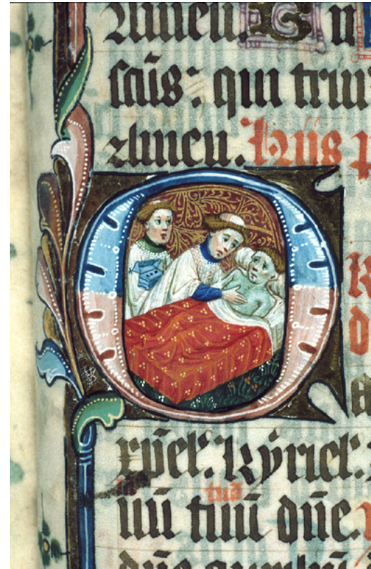
Un dels treballadors que es consagra a els demes: un capellà administra els últims sagraments a un moribund. [ Fig. 189 ]

Aquesta noció de protecció ens condueix a la subclasse de persones de servei, que sense ser necessàriament servents contractats, vivien dels seus vincles personals “[...] trabajar sin una remuneración determinada o apenas