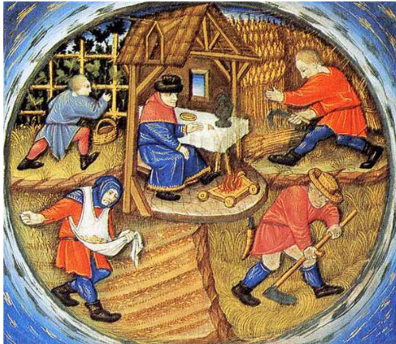
Treballadors agrícoles fan diferents tasques de les quatre temporades. Al centre de la imatge, el senyor descansa. [ Fig. 193 ]

vi, per exemple, eren un èxit indiscutible, però no fou mai un producte car, i els productors havien de pensar cada any a pagar el delme, la tasca, els censos, l'ús del celler i altres càrrecs que els emfiteutes estaven obligats a rendir al senyor, a l'església i al rei.