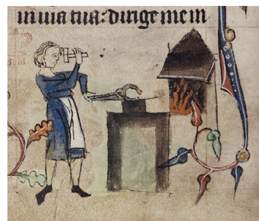
El ferrer i el fuster foren artesans imprescindibles en tota comunitat. [ Fig. 199 ]

Com passa amb les iniciatives per determinar la població illenca, hi ha diferents càlculs del nombre d'esclaus i esclaves. Per dos historiadors recents: Onofre Vaquer (1997, p. 246) parla d'un esclau per cada tres persones lliures el 1328-9 (el 30% de la població), mentre que Mas Forners (2005, p. 29) posa el percentatge a menys: el 10% al mateix moment, però parlant d'esclaus barons adults de la part forana.