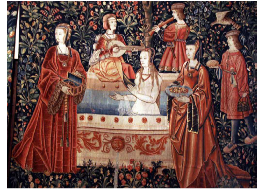
Detall d'un tapís que, altra vegada, representa un ideal de luxe i esplendor. Fins i tot, els assistents són éssers superiors, no servents reals. [ Fig. 191 ]

encontraban los “miserables” que no siempre lo eran, mendigos, rateros, desolladores, “caimanes” o simples bandidos del bosque [...] Estos también, sin duda alguna, trabajaban por completo a costa de los demás” (2008, p. 133).