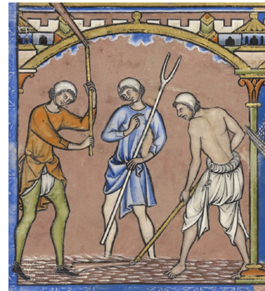
Tres jornalers, “que treballen en benefici de les persones que les paguen”. [ Fig. 190 ]

estimable, pero a cambio de ventajas vinculadas a la actividad: regalos, responsabilidades que daban pie a un casuel, pequeños beneficios obtenidos por el esfuerzo proporcionado [...]”