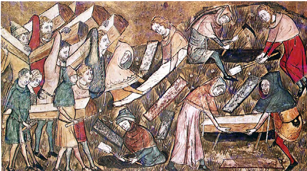
Enterrant víctimes de la pesta negra al cementiri de Tournai als Països Baixos, l'any 1349. El pànic i confusió causats per la malaltia estan reflectits en aquest detall d'una miniatura del mateix segle XIV. [ Fig. 174 ]

L a més notòria pandèmia de pesta negra combinava totes tres variants de la malaltia causada per la complexa varietat del bacteri Yersinia pestis , del qual s'ha dit que 'la toxicitat varia, però la malaltia és sempre summament mortífera' (traduït de Gottfried, 1983, p. 6). La seva entrada a Europa des de l'est no podia haver estat més dramàtica; a l'octubre de 1347 un estol genovès entra, d'alguna manera, al port sicilià de Messina amb tota la tripulació morta o moribunda. Els oficials del port intentaren imposar una quarantena a les persones, però els agents de la malaltia, les rates i les seves puces envaeixen sense obstacle.