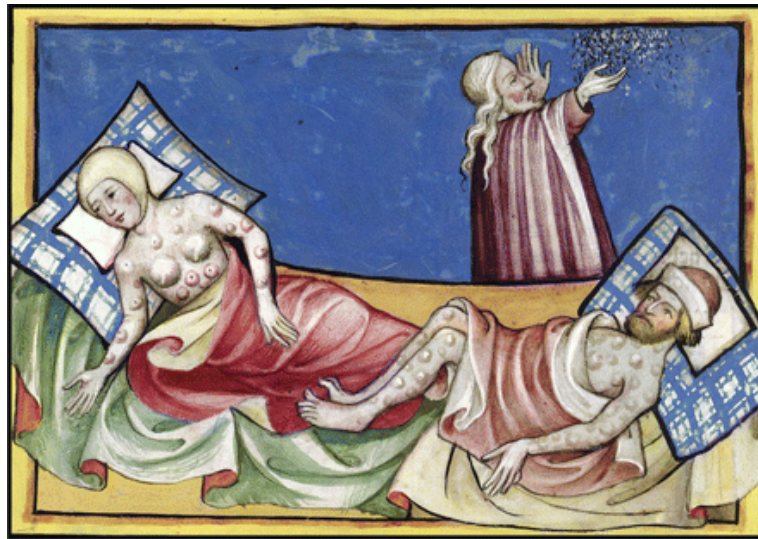
Una il·lustració d'una 'crònica del món' de Suïssa que tracta sobre les 10 plagues d'Egipte, però de fet descriuen la plaga més fresca en la memòria de la gent, la pesta bubònica. (És probable que l'altre personatge sigui Moisès.) [ Fig. 175 ]

gent estava acostumada a la mala fortuna i a desastres incomprensibles, però la pesta negra porta el terror i desconcerta a un nivell encara desconegut a l'època.