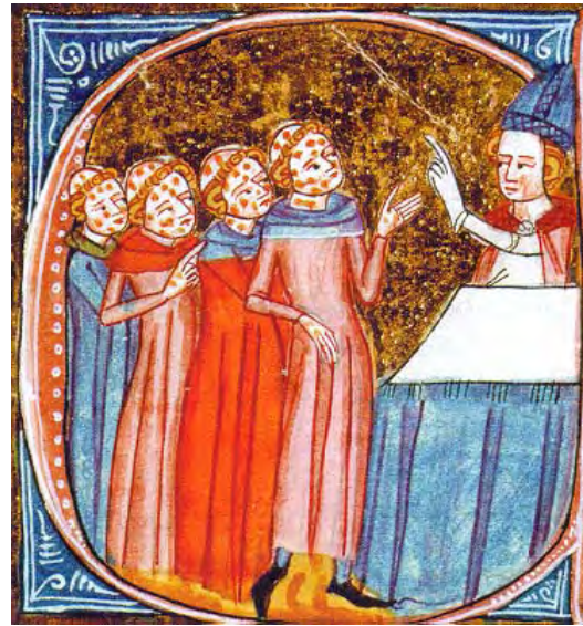
Els clergues foren molt afectats per la pesta a causa de la seva responsabilitat d'assistir als malalts i moribunds. Aquí un bisbe beneeix un grup de frares malalts (notau seves tonsures) posant-se ell mateix en risc de contagi. És de l'enciclopèdia De Omne Bonum . [ Fig. 178 ]

terrestre. Atès el lamentable estat dels camins, una alta proporció del transport fou marítim abans de l'era moderna. Segons un estudi de l'historiador Pau Cateura, “[...] aparece el tráfico costero de mercancías entre las villas que poseen términos municipales lindantes con el litoral y la Ciudad. Este tráfico de cabotaje se muestra como práctica común en la documentación de los siglos XIV i XV.