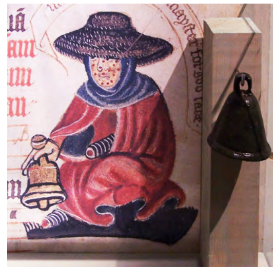
Aquí veiem un malalt amb una de les campanes que els leprosos foren obligats a tocar mentre circulaven entre la població. És de Dinamarca, les malalties contagioses s'estenqueren per tot arreu. [ Fig. 176 ]

La gran llàstima de l'atribució dels contagis a la ira divina era que quasi ningú no cercava cures ni remeis en aquesta època. La devastació causada per la pesta negra impulsà, no obstant això, l'establiment d'un estudi de la medicina sobre una base més racional, més natural. Això passaria més tard, però, en part perquè algunes de