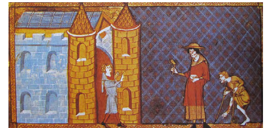
'L'ensurt de 1321', causat per rumors malintencionats al sud de França, provocà manifestacions contra grups minoritaris com els musulmans i jueus amb acusacions d'emprar leprosos per causar la propagació de la lepra a més d'enverinar pous, etc. Els disturbis s'escampaven a Catalunya-Aragó però el rei Sanç de Mallorca evità que s'estenguessin a les Illes. Aquí dos captaires malalts de lepra, un que porta una "carraca" per advertir de la seva presència, són denegats l'accés a una ciutat (Carcassona?). [ Fig. 179 ]

Tanta desgràcia es cobrava costos psicològics i físics, sobretot en el cas de la pesta negra, igual de devastadora que d'inesperada. Algunes poblacions renovaven