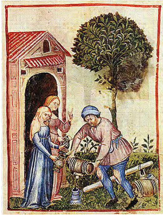
L'oli d'oliva va servir més per il·luminació que per cuinar. El greix d'animals era bo per cuinar, però cremar-lo en un llum era –i és– un desastre. [ Fig. 166 ]