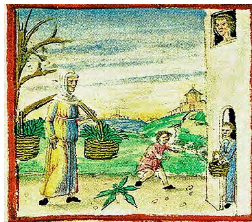
La venda d'espínacs a casa; una manera d'evitar pagar les taxes del mercat? [ Fig. 164 ]

Els ingredients del pa canviaren al llarg del segle, essent al principi pa de blat, el pa de mestall (mesclat de blat i ordi) o el pa d'ordi