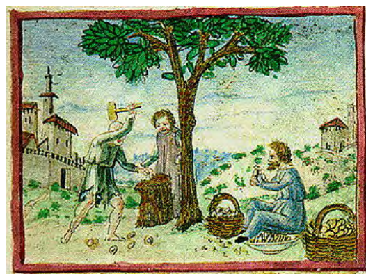
La venda de castanyes calentes a l'hivern encara persisteix avui, com també la popularitat de les ametlles. [ Fig. 162 i 163 ]

—encara que més disminuïts— que no en operacions mercantils de més risc, però de més guany i sobretot, més profitoses per l'economia del Regne (Morro Veny, 1998, p.32).