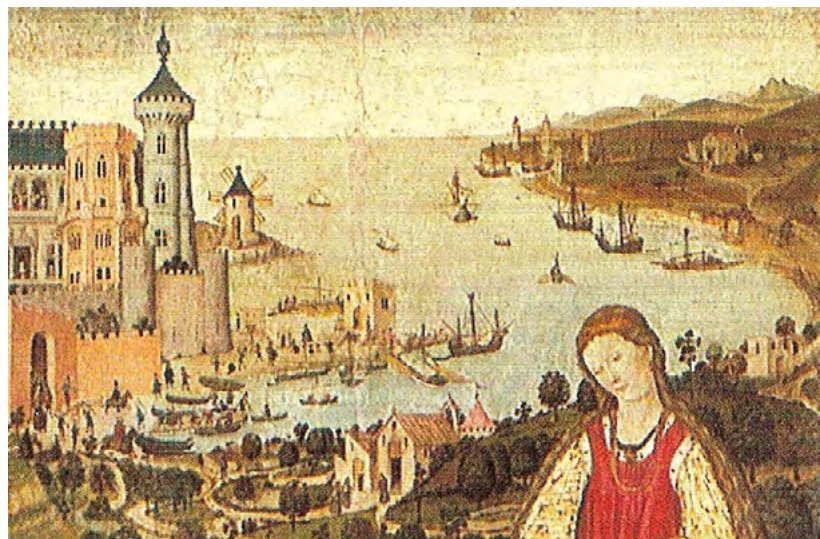
Al retaule de Sant Jordi de Pere Niçard tenim una vista parcial del port de Ciutat al segle XV. És evident que al pintor li interessaven més els murs i edificis que l'entrada per mar, però podem veure les galeres grans fondejades en fila fora del port i nombrosos vaixells més petits prop dels murs de l'Almudaina. [ Fig. 127 ]

l'avantatge de permetre arrasar amb els habitants existents. Així doncs, la terra fou ocupada de nou sense possibilitat de cap reclamació dels antics habitants.