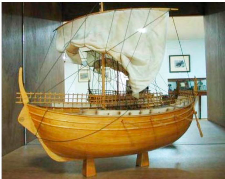
Un model modern del vaixell emprat al comerç marítim mediterrani a l'edat mitjana. Noti's la provisió de rem a més de les veles i l'espaiós buc per càrrega de mercaderies. [ Fig. 126 ]

Durant l'alta edat mitjana, dels segles IX al XII, a Europa hi va haver una explosió demogràfica descomunal, calculada per alguns estudiosos en un augment de la població del 300 per cent, després de segles d'estancament. La conjuntura favorable d'un clima més suau, la manca d'epidèmies i les millores en la pràctica agrària, la font de riquesa o de subsistència de quasi tothom, possibilitaren un creixement de la població i l'increment de la prosperitat per tot el continent. En resultà l'ampliació de l'extensió de la terra cultivada, capaç d'alimentar una població més gran, i la comercialització dels excedents al mercat. Els governants del nord d'Europa estenien els seus dominis cap a l'est, i tímidament