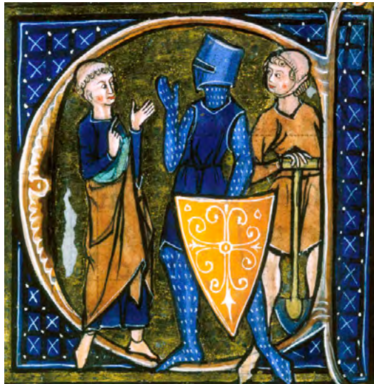
Una representació dels tres grups més rellevants a l'alta edat mitjana: els cavallers, els clergues i els pagesos. L'estructura de la societat estava poc desenvolupada i tan sols s'inclouien els 'qui ora', 'qui lluita', i 'qui treballa la terra'. [ Fig. 119 ]

Quan el 1244 es parlava de gravar "tots els que possien béns al reialenc o que els haguessin