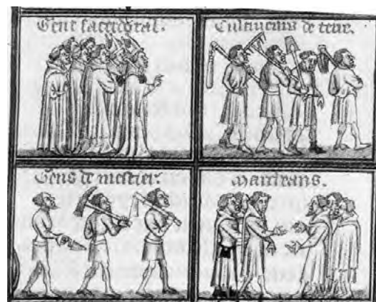
Aquest esquema, força diferent de l'anterior, prové d'una traducció d' Aristòtil. És de París i, des de les ciutats, sorgir la reorganització de la societat. Al nivell més alt es troba 'la gent d'armes' i 'de consell' la nova burocràcia; enmig, 'la gent sacerdotal' i 'els pagesos'; i en una tercera fila del tot nova, els artesans i els comerciants. [ Fig. 120 ]