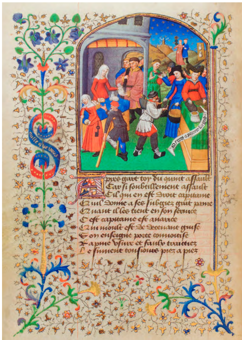
Una pàgina d'un llibre al·legòric d'històries morals. Aquest il·lustra "El camí de la pobresa i la riquesa". A la dreta, la Senyora Generositat dona una moneda a un pobre vell al costat de la Senyora Avarícia que contempla les seves possessions. Al centre, la Senyora Misericòrdia dona pans petits a un minusvàlid i una criada, mentre un recaptador d'impostos li exigeix una bossa gran de diners. Darrere, un home sense treball roba al Senyor Ciutadà a punta de ganivet. [ Fig. 123 ]