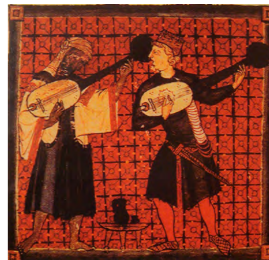
Dos músics, un musulmà i un cristià, toquen el llaüt a la cort del rei Alfons X de Castellà i Lleó a la segona meitat del segle XIII. Alguns historiadors pensen que els trobadors tenen un deute amb les tradicions de la música àrab d'Al-Andalus. [ Fig. 124 ]

Els jueus vivien en un estat de tutela al Regne de Mallorca com protegits del rei, per qui constituïen un imprescindible