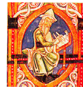
El filòsof i historiador jueu, Flavius Josephus, del primer segle dC, representat com un jueu contemporani en una miniatura medieval de la península Ibèrica. Porta el capell apuntat obligatori pels jueus de l'indret i l'època. Els jueus sempre insistien en la importància de l'educació i amb freqüència ocupaven llocs de treball rellevants a l'administració. [ Fig. 125 ]

Els musulmans lliures estaven gravats, si quedaven a Mallorca, amb l'estància, i si emigraven, amb l'eixida. La majoria marxaren. De lliberts tenim notícies d'uns cristians o conversos, sobretot algun grec, tàrtar o rus, que s'integraven i vivien com els altres pobladors de Binissalem, on segurament també pagaven impostos de la mateixa manera. Hi havia casos d'esclaus o lliberts que aconseguien treball com a majorals en algunes possessions, ja que eren persones amb una formació superior a la dels veïns cristians.