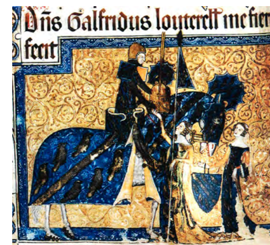
Un retrat que ostenta el poder i la riquesa d'un cavaller. Aquí molt més que un 'home que lluita', és un personatge que aspira a tots els privilegis de la noblesa. L'atenen la seva dona i la nora. [ Fig. 121 ]

honorats i d'alguns alts administratius i cortesans. Quasi tots els nobles arribats de la península hi havien tornat poc temps després de la conquesta, i havien deixat els cavallers com a classe amb més rellevància. Aviat, els cavallers organitzaren la seva pròpia confraria: una estructura formal que lluitava per reafirmar i codificar els seus privilegis. El 1363 el rei Pere IV els concedí reconeixement com a braç militar, un estament social propi. No era fàcil d'entrar en aquesta classe durant el període del regne de Mallorca (fins el 1343), quan els