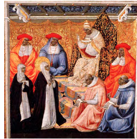
Santa Caterina de Siena parla amb el papa Gregori XI a la seva cort en exili a Avinyó. Protegida per la seva santedat, Caterina, que no tenia rang en l'estructura de l'església, s'atreu a aconsellar al papa i ell no tan sols la rebia, sinó que decidí tornar al Vaticà. L'obra és de Paolo de Giovanni, pintor sienès del segle XV. [ Fig. 122 ]

Entrar en l'enorme estructura de l'església era molt senzill en els nivells més baixos: hi havia innumerables tasques en el camp espiritual. Per ser identificat com a clergue només es precisava la tonsura i l'hàbit, i a més, segons el càrrec, un mínim de formació. No obstant això, simplement portar un hàbit no sempre procurava les exempcions desitjades, perquè hi havia