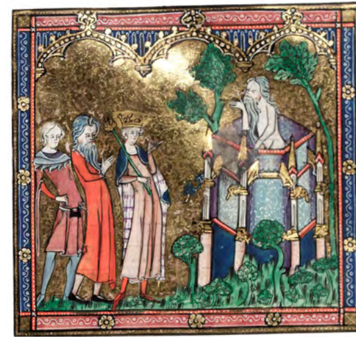
Una reina visita un ermità que viu al bosc. Ella ostenta de la seva condició, porta la corona i el ceptre, la seva capa sembla folrada d'ermíni i saluda l'ermità amb tan sols un dit. [ Fig. 106 ]

Hi havia ben poca intimitat, fins i tot al llit. Un convidat podia compartir l'únic llit (animalons i tot) amb els amfitrions. N'hi ha que diuen que s'usava dormir nu, però el fet que la gent no tingués roba de nit no vol dir que no portàs la mateixa roba que de dia. Sembla veritat que a l'edat mitjana la nuesa no escandalitzava. Per pobresa, calor o fervor religiós, alguna gent circulava pel món sense roba, almenys al nord d'Europa, i probablement aquí també. Pensem en les representacions religioses on eremites, segons quin sant, o el mateix Jesucrist es mostren nus.