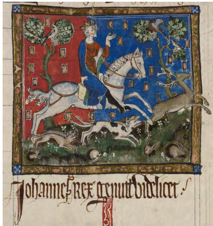
Un rei (Joan d' Anglaterra) gaudeix del seu divertiment favorit, la caça del cérvol. [ Fig. 111 ]