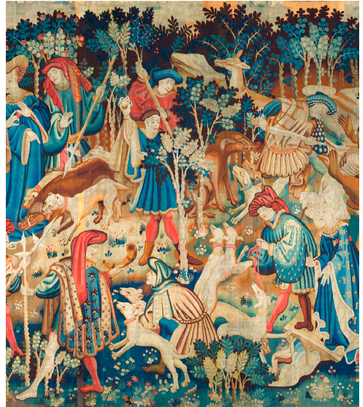
Un detall d'una tapisseria de grans dimensions i luxe; "La caça de l'ós i el porc senglar", una representació ideal de la caça, poblada de nobles vestits per presumir no per fer l'esport, que data del 1425-30. Mesura aproximadament 10 m x 4 m i fou teixit a Flandes o a França. [ Fig. 112 ]

En un extraordinari document de l'any 1343, una carta de la reina d'Aragó, aquesta demanava al procurador reial de Mallorca** que li enviàs dos lleons mascles i dos xacals de Barberia (Salom i Bujosa, 1945, p.187). Possiblement no era una cosa gaire extraordinària, ja que com Ramon Llull va anotar, al seu Llibre de l'ordre de cavalleria (1274-6), la caça "de cérvols i conills, ossos, lleons i animals similars" en la relació dels deures d'un cavaller (Richard Barber, 1980, p. 110).