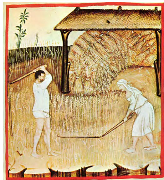
Una parella pagesa trillant, vestits per treballar. [ Fig. 109 ]

Un altre aspecte a tenir en compte eren les assignacions pressupostàries oficials per comprar roba, acompanyades per una normativa detallada, no tan sols per als funcionaris, sinó també per als càrrecs electes com a jurats. En temps de penúria, les autoritats intentaven reduir les subvencions per a vestits, però això causava protestes enèrgiques dels afectats, no només pels