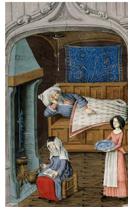
Una miniatura que il·lustra la història bíblica de Tobit, traslladada a l'entorn del pintor; a finals del segle XV, a Bruges. A nosaltres ens interessen els detalls de la casa amb l'home, Tobit, dormint sobre un arquibanc amb una estora o cortina penjada a la paret de darrere. Sembla una postura força incòmoda, però a l'edat mitjana, la gent sovint dormia així amb el cap elevat, en llits curts. Tot i que sembla la casa de gent acomodada, la dona cuina a la xemeneia de la mateixa habitació mentre consulta un llibre; potser de receptes. Ella s'ha arromangat la falda del vestit per protegir-la de les espurnes del foc. [ Fig. 110 ]

No obstant això, hi havia imatges, normalment de la Verge, de fusta o gravades en paper, exposades a l'entrada de la casa.