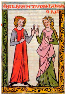
L'estil de vestir universal del segle XIII, igual per homes i dones. [ Fig. 107 ]

Allarg del segle XIII, l'estil de la vestimenta era senzill, constant i igual per a tothom i per ambdós sexes. La túnica d'un rei, una