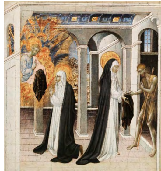
A la dreta, Jesucrist disfressat com un pidolaire apareix a Santa Caterina de Siena qui li dona una manta. A l'esquerra, li revela la seva identitat. Una pintura italiana de vers el 1450. [ Fig. 105 ]

Les notícies passaven d'un punt a un altre del poble com un llamp, i per qualsevol 'remor' la gent cercava tot el món per veure què passava. El senyal que passava alguna cosa fora del normal era el crit de «Via fora!». * Les dones sortien de les cuines, i algunes persones anaven corrents a avisar el batle i tots els jurats i prohoms que poguessin trobar.