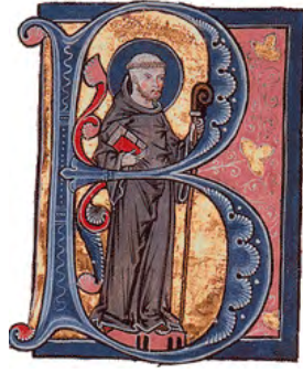
Sant Bernat de Clairvall representat dins la lletra 'B'. Porta el llibre de les regles de l'orde benedictí del qual el fou un reformista important. [ Fig. 80 ]