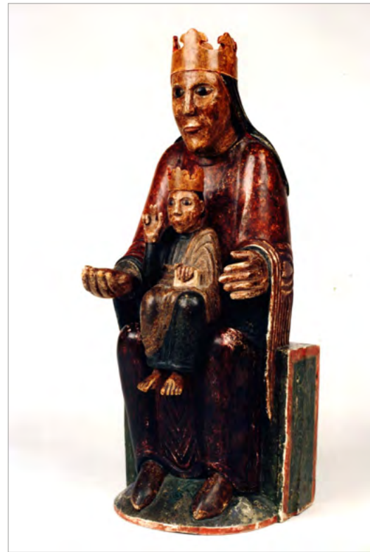
La Mare de Déu del Cocó després de la seva restauració que involucrà una reconstrucció extensiva. [ Fig. 78 ]

XII i XIII. Està envoltada de llegendes màgiques molt semblants a les de la Verge de Lluc, la més famosa de la dotzena d'imatges "trobadés" a Mallorca poc després