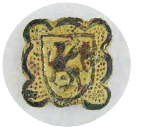
Un petit escut de metall, trobat l'any 2008 a Santa Ponsa, que porta el segell de la família Togores: un griu, criatura heràldica, meitat lleo i meitat àguila. Al ser trobat al lloc de la primera confrontació amb els defensors musulmans, es confirma la presència del germans Togores des del primer desembarcament a Mallorca l'any 1229. [ Fig. 75 ]

El segle XIII ja hi havia colonitzadors establerts a l'alqueria d'Aiamans. Al començament de la dècada de 1240 el procurador del cavaller, Pere de Calders, va establir algunes emfiteusis de terrenys petits a les terres del cavaller Arnau, que en la seva totalitat comprenia 560 quarterades. Les escriptures esmenten condicions físiques similars a les trobades pels primers pobladors de Robines, amb terres sembrades de vinyes, arbres fruiters i oliveres. El pare Capó indica que els nous pobladors solien