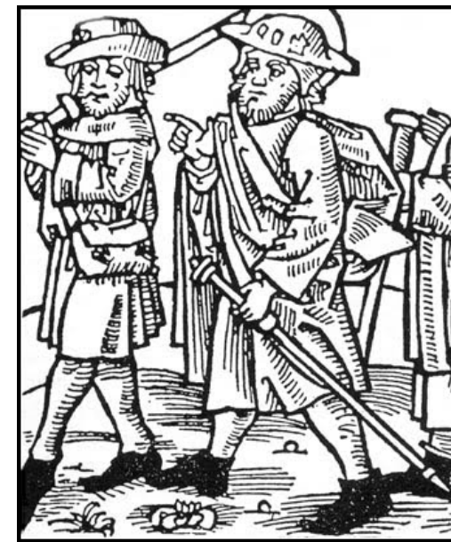
2 pelegrins medievals amb els seus capells característics, les seves bosses i bastons preparats per una llarga caminada. [ Fig. 79 ]

De fet, no tenim documentació d'una capella a Lloseta fins a l'any 1282, però els