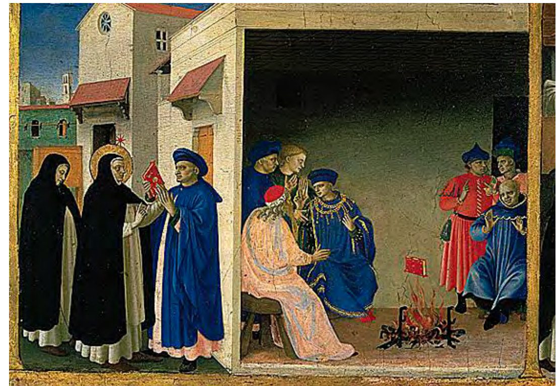
Un artista famós i monje dominicà, Fra Angelico, retrata - encara que tard, prop de 1434 - la lluita contra els càtars. A l'esquerre sant Dominic donà una Bíblia catòlica a uns càtars, que a la dreta intenten cremar-la, però miraculosament el llibre salta del foc. [ Fig. 74 ]

Així doncs, l'ansia de poder i riquesa contagiaven eclesiàstics a tots els nivells; l'església havia esdevingut una vasta empresa, que comerciava amb els temors i la pietat