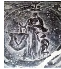
Una placa en relleu dels Països Baixos mostra santa Elisabet tenint cura dels pobres. Només va viure del 1207 al 1231, però era casada amb tres nins i va enviuar als 20 anys. Es va fundar un hospital al 1224 i s'afilià al tercer orde de sant Francesc. Mori als 24 anys, famosa per la seva santedat i obres piadoses. Circulaven notícies de miracles seus i fou declarada santa el 1235. [ Fig. 72 ]

Una placa en relleu dels Països Baixos mostra santa Elisabet tenint cura dels pobres. Només va viure del 1207 al 1231, però era casada amb tres nins i va enviuar als 20 anys. Es va fundar un hospital al 1224 i s'afilià al tercer orde de sant Francesc. Mori als 24