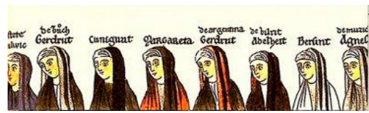
Una fila de beguines medievals, senzilles i modestes [ Fig. 70 ]

També s'ha de distingir entre l'heretodòxia i el reformisme, cosa que no feien les autoritats eclesiàstiques d'aleshores, que els titllaven a tots d'heretges religiosos, "[...] cualquier sospechoso, inconformista o rebelde no solo en el terreno teológico, sino también en el de las costumbres y en el de la filosofía". Continua "lo más justo es afirmar que la mayor parte de ellos no eran haeretici formalmente, ni técnicamente siquiera, pues se limitaban a escandalizarse y gritar contra abusos reales [...]" (Antonio Oliver, 1963, p. 157).