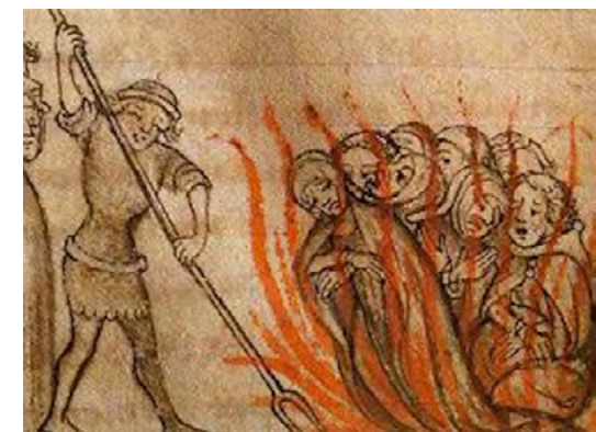
Beguins i beguines cremades per heretges. [ Fig. 73 ]

Encara no s'havia inventat la premsa mecànica, i el tresor dels texts del període clàssic era desconegut per a la majoria de gent que no podia ni llegir ni escriure.