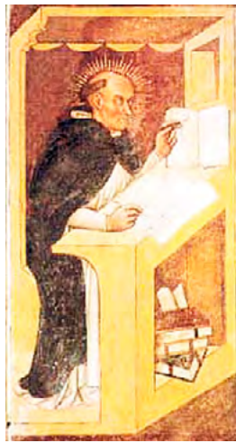
Un dels millors intel·lectuals de la seva època, sant Ramon de Penyafort (1180 -1275) redactà Els Decretals de Gregori IX , un codi de dret canònic, i introduí la Inquisició a Catalunya Aragó. L'objectiu era la supressió del catarisme i a la fi la Inquisició tenia l'èxit que no havien aconseguit ni croades ni exhortacions. Ell s'afilià al nou orde dominicà i l'hàbit que porta aquí ho és. [ Fig. 68 ]

Fins i tot al si del vell orde benedictí (fundat al segle VI) sorgeixen grups reformadors, com els de Cluny i del Cister. Un nou orde diferent fou el dels templers, cavallers religiosos associats per defensar el terreny conquerit a Terra santa. La seva percebuda fiabilitat, i una xarxa extensa de sucursals pels països cristians, els impel·lien a ser els banquers d'Europa. Els nous ordes solien tenir relacions fluctuants amb els bisbes i el papa, i gaudien de més o menys llibertat dins l'estructura de l'Església catòlica segons la seva habilitat de maniobra a l'espai que havien escollit. A l'ombra d'aquestes grans entitats, altres ordes religiosos petits i locals creixien com a bolets.