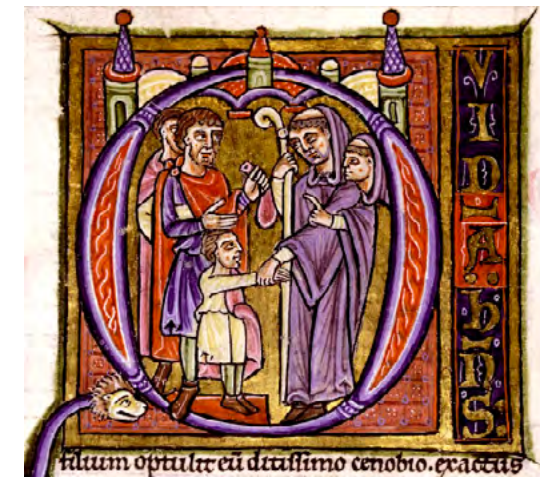
En un cas de simonia al segle XII, un abat accepta una saca de diners. Podia ser per col·locar el nin? Noti el curiós home de darrere l'abat de qui tan sols veiem el cap i el braç esquerre. [ Fig. 67 ]

Aquestes inquietuds i demandes sorgien amb més força als llocs on els paràmetres de la vida canviaven: concretament on els negocis florien, com per exemple a les noves ciutats, amb un increment notable de població, comerç i prosperitat. Tanmateix, l'increment de l'activitat intel·lectual, fomentat a les noves universitats o seguit per persones que gaudien de temps per