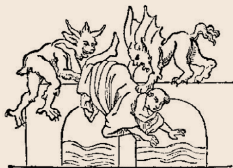
Dos dimonis ofeguen un monjo al riu Tíber en una imatge del segle XIII. [ Fig. 40 ]

L'església s'encarregà d'organitzar el nou regne de Mallorca des del primer moment.