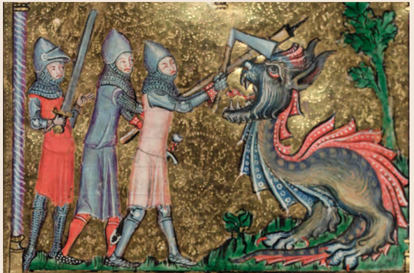
Un drac, que sembla mig decoratiu, mig aterridor és atacat per tres cavallers amb armes de guerra. El seu cap és atípic, sembla més d'un caní. La imatge és de 1338-1344. [ Fig. 38 ]

Ens ho hem d'imaginar per entendre el poder de la religió sobre la societat. No hi havia cap punt de referència alternatiu a la religió, com tampoc no hi havia cap força humana que es pogués resistir al sobrenatural. El coneixement del mètode científic no estava generalitzat i els llibres i estudis necessaris per fomentar un pensament rigorós eren limitats i fora de