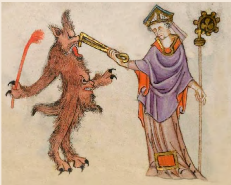
Un bisbe afronta una criatura grotesca. Podria ser un home llop? Imatge de 1325 a 1345. [ Fig. 39 ]

havia tan sols una veritable religió i el pasaport al món vertader, que era el paradís, únicament estava disponible per els devots de l'església santa, apostòlica i romana.