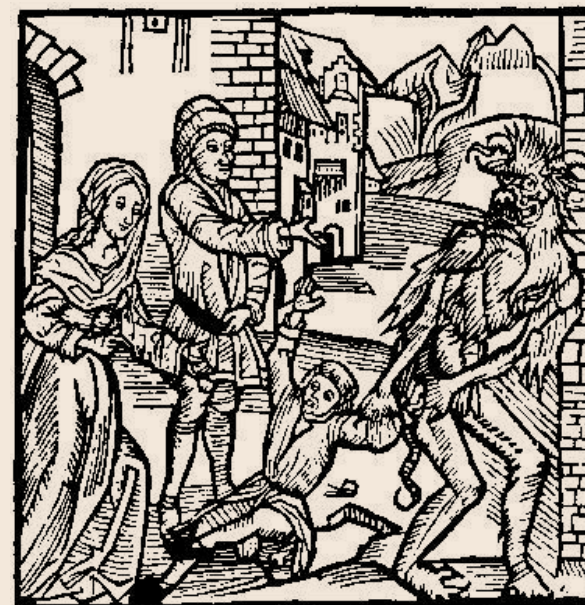
Un nin promès a Satanàs en un pacte diabòlic és arrossegat lluny dels seus pares per un dimoni. El tema d'un pacte amb el diable, fet per desesperació o per fer complir un desig, era molt comú a l'edat medieval. Aquesta imatge acompanya un conte moral francès del segle XIV. Els gests dels pares signifiquen la seva conformitat. [ Fig. 41 ]

El projecte de la conquesta fou una croada dirigida personalment pel papa, un dels promotors més actius. Mentre que altres religiosos i civils tenien els seus propis motius, com ara beneficis econòmics, millors perspectives o l'assoliment de la glòria en la guerra, per al papa l'important era la restitució d'una província perduda davant el gran enemic, l'islam, feia més de 300 anys. En certa manera, tothom va assumir el seu punt de vista. Encara parlem de 'reconquesta', però