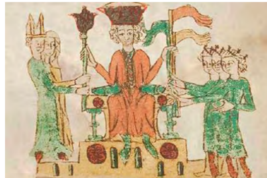
Del mateix manuscrit alemany, un rei investeix diversos vassalls amb símbols de la seva relació feudal: un bisbe i una abadessa amb un ceptre i tres terratinents amb estàndards. [ Fig. 28 ]

S'han destacat els orígens militars del sistema: el senyor era un home armat amb capacitat per defensar els seus vassalls. A mesura que passà el temps, però, el caràcter de 'senyor' i 'vassall' s'amplià. Al segle XIII, el se-