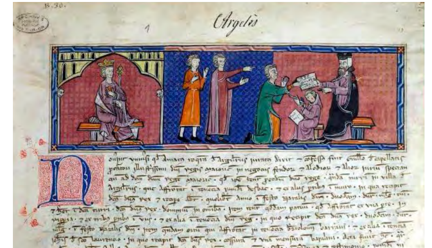
Del Capbreu de Argelès de 1292. Un procurador del rei Jaume II rep els documents que justificaven els drets territorials d'un terratinent. Aquest està acompanyat per dos testimonis i al fons un notari registra les escriptures de la propietat. Argelès està a Rosselló, a uns 15 kms de Perpinyà. A l'esquerra està assegut el rei. Entre 1285 i 1299 Jaume II tan sols fou rei als territoris continentals del Regne de Mallorca. [ Fig. 29 ]

El senyor solia imposar altres obligacions lligades al bé immobiliari, com la fadiga , un termini de dies durant el qual el senyor podia comprar o determinar les condicions de la venda d'un bé que l'emfiteuta volgués vendre,