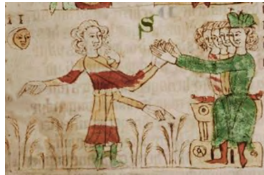
Una il·lustració gràfica del ritu d'homenatge. El senyor, en presència de la seva cort, pren les mans del vassall entre les seves. Per reflectir millor la relació entre senyor, vassall i terra, el vassall té tres mans addicionals, una que apunta a ell mateix i dues que apunten a les terres que comprèn el feu. Forma part d'un manuscrit alemany de principis del segle XIV, el Heidelberger Sachsenspiegel . [ Fig. 27 ]

El feudalisme havia nascut en un altre context. La característica que el distingia era la de ser un peculiar enllaç entre propietat immobiliària i persones físiques. El contracte feudal era per la prestació de servei en contrapartida del subministrament de mitjans de vida, sense utilitzar diners. Els diners circulaven molt poc els primers segles de l'edat mitjana: la riquesa eren les terres productives i els homes per defensar-les contra persones que volguessin apoderar-s'en. Així, el con-