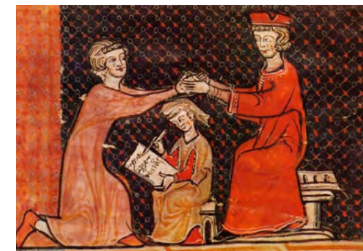
Una acte d'homenatge a Perpinyà al segle XIII, a l'època quan Perpinyà era la capital peninsular del Regne de Mallorca. [ Fig. 26 ]

El feudalisme es desenvolupà els segles VII, VIII i IX, però encara prevalia al regne d'Aragó, al comtat de Barcelona i a tots els comtats i terres adjacents, el temps de la conquesta de Mallorca. El Conqueridor, el rei En Jaume, amb la justificació legal de ser al cap d'una croada santa, havia arrasat per