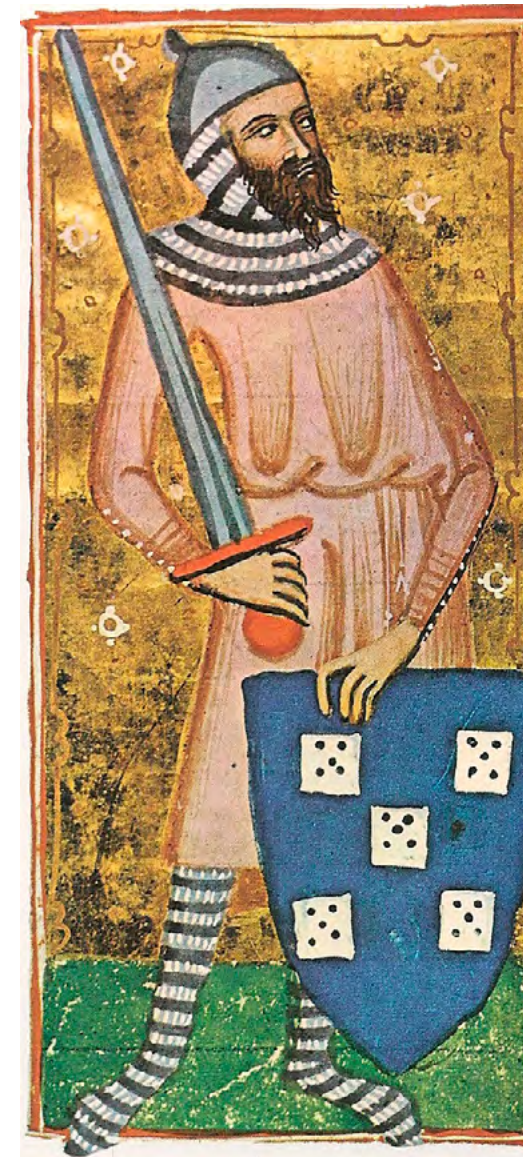
Linfant Pere de Portugal. [ Fig 18 ]

Què podria debilitar aquest monòlit? Només les errades humanes, arrelades en la supèrbia de pensar-se intocable pel fet de posseir la suposada veritat eterna. És segur que en el període de la creació del Regne de Mallorca l'estructura ja havia començat a tremolar. El coneixement de les pallassades individuals d'alguns eclesiàstics o les pràctiques abusives de l'església no tenien una difusió generalitzada i l'espectacle de tres pretendents simultanis a ser papa és encara una cosa del futur; però la jerarquia ja tenia raons per preocupar-se.