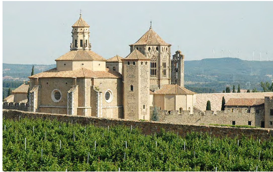
Monestir de Santa Maria de Poblet, fundat el 1151, que era un dels més rics de Catalunya, i el lloc escollit pel rei En Jaume pel seu enterrament. [ Fig 17 ]

havia estat reclutat. És molt probable que el primer bisbe de Mallorca, Ramon de Torrella, fos un erudit o un funcionari de l'església, fill d'una família catalana distingida, no un home religiós. Sembla que s'ordenà de sacerdot després d'haver estat nomenat bisbe.