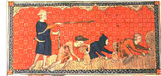
Pagesos recollint gra baix els ordres del majoral. (Segle XIII). [ Fig. 14 ]

D'aquesta notícia podem deduir unes circumstàncies. Entre la primera i la segona escriptura, els homes de Vic havien fet donació de 5 jovades de terra a la seu de Mallorca que eren part o tot del 10% obligat a tots els propietaris. Quatre eren a l'alqueria de Benisalem. Potser el bisbe tenia ja el domini directe de les dues jovades, i així hauria comprat una cosa ja "seva". Va comprar, però, el domini útil per explotar la propietat, dret