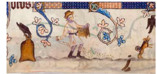
Sembrant a l'Anglaterra, una hivern de la primera meitat del segle XIV. [ Fig. 12 ]

Una de les particularitats del repartiment fou la concessió de terrenys allunyats i amb diferents característiques. Així fou lògic donar Aiamans i Lozeta, separades, encara que no molt, de Beniali. Podem suposar almenys dos motius per fer-ho