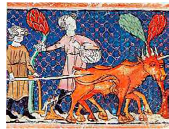
Pagesos de la península Ibèrica del segle XIII llaurant amb bous. Es nota que els bous són bastant magres. [ Fig. 13 ]

Un detall curiós és el fet que un any i mig abans de la creació d'aquesta cavalleria, el 10 de maig de 1231, el mateix sagristà de Girona, Guillem de Montgrí, havia nomenat en Ramon de Vall.llebrera com el seu procurador. El 19 de novembre del 1231, Ramon, en nom del sagristà, cedia a Pere de Segarra dues jovades de terra a l'alqueria anomenada Tofla*, a l'altre pendent del lloc on en Ramon adquirirà la cavalleria més tard. El contracte especificà que "fara delme i tasca" (FRB 1, 1977, p. 103).