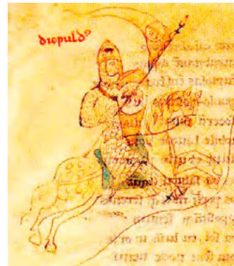
Un cavaller armat del segle XIII a punt per lluitar. [ Fig. 11 ]

Normalment es pagava una entrada, un cens anual i l' alou i el lluïsm e quan venien o cedien les seves terres a persones que no eren familiars descendents directes. El cens anual no solia ser molt oneros, però cada nova cessió portava el pes impositiu de les anteriors. Les obligacions acompanyaven la propietat i cada nou propietari era responsable de tots els