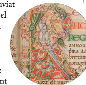
A l'època del nostre relat, un llibre era un objecte de gran luxe i la paraula escrita era desconeguda i irrellevant per la majoria. La producció d'un text era treball d'erudits i la tasca de decorar era d'artistes o pintors. Aquí un escriptor porta un pergamí i ploma dins un marc embellit amb criatures sobrenaturals i grotesques. Tot forma part de la lletra 'R' d'un manuscrit en llatí. [ Fig. 4 ]

El primer anunci de les tribulacions futures arriba amb la fam de 1324-25, que, coincidint amb la mort del rei Sanç, provocà 'commocions' als carrers de Ciutat. Al nord d'Europa, els anys 1316-19 han estat terribles: hiverns i estius de pluja i fred amb collites inexistent, mentre bandes de pagesos: desterrats i miserables, que literalment es moren de gana, vagaven per l'àrea que avui formen França, els Països Baixos i Anglaterra. Al Mediterrani, però, el rumb de la vida continua sent positiu.