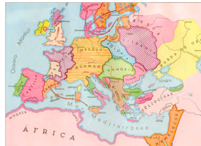
"Europa a mediados del siglo XIV. Aragón [Catalunya-Aragò] desarrolla una gran política mediterránea: posee Baleares y Cerdeña y aspira al dominio de Sicilia, donde reina una dinastía de la casa de Barcelona". (País Global, Mapas de Historia Universal) [ Fig. 3 ]

Coneixerem millor aquests homes i molts dels seus contemporanis, perquè, dins